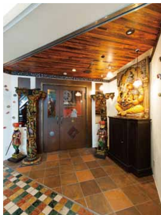
■ エントランス ガネーシャ像を中心にインドらしい飾り付けに。ランチボードなど告知スペースも充分にとった集客力のあるエントランスに