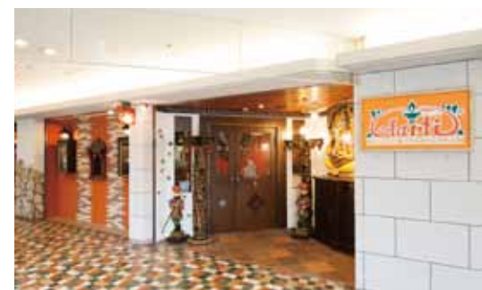
■ エントランス カラフルなタイル張りフロアともしっかり馴染んだエントランス