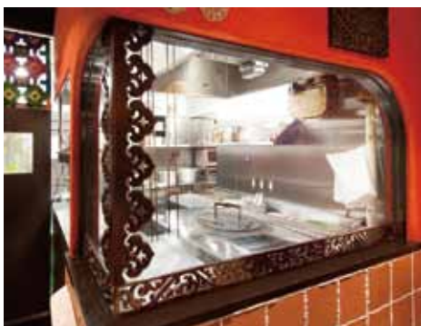
■ タンドール ホールからもタンドールでナンやタンドールチキンを見事に焼く上げるインド人シェフの姿が見えるのも強力な演出