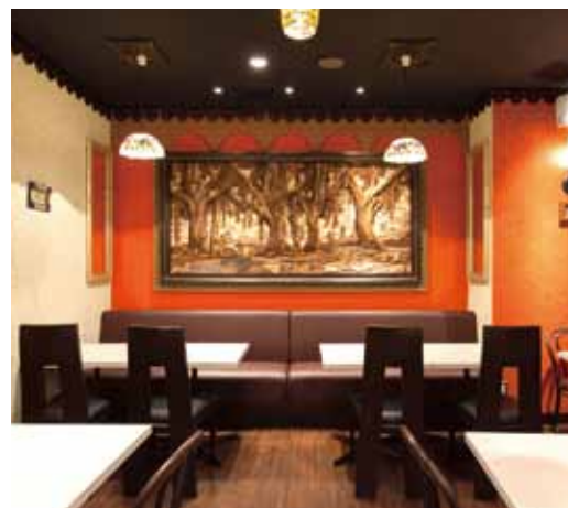
■ ホール 赤い壁にインドより直送された渋い色合いの木彫画が印象的です