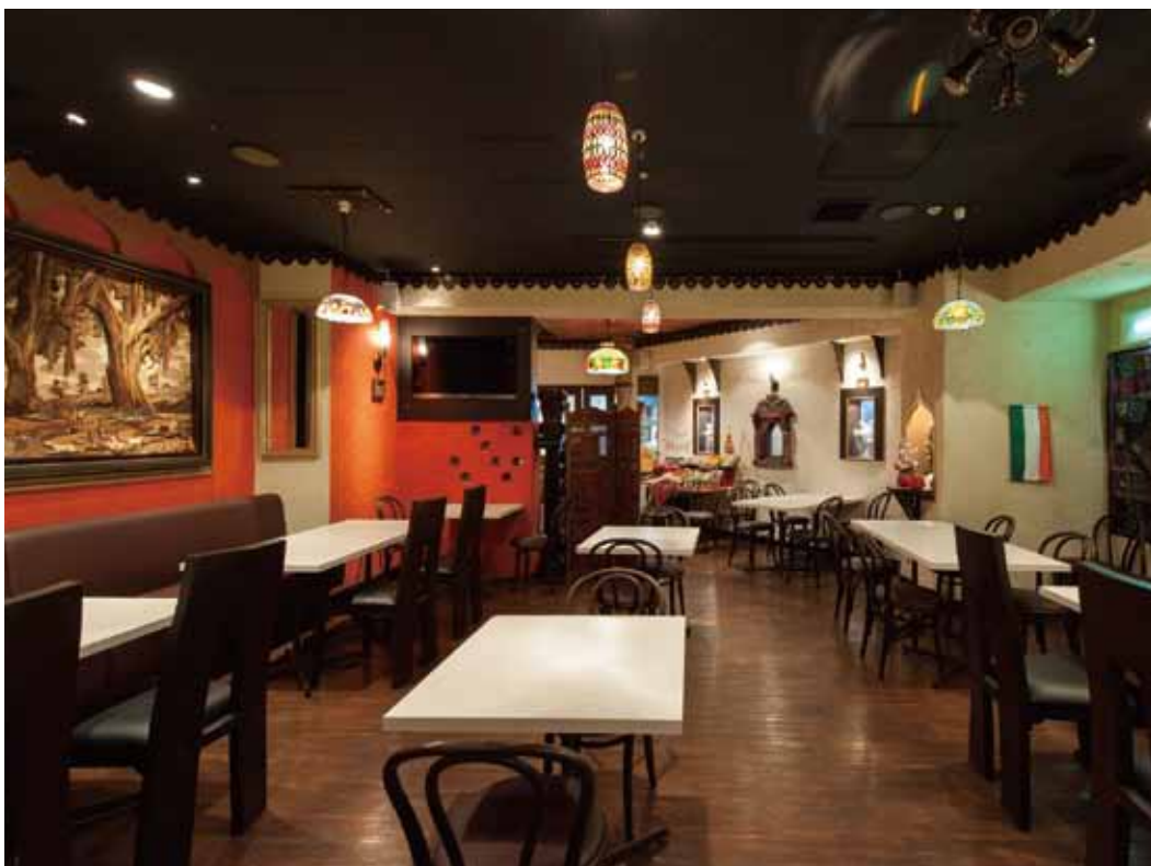
■ ホール ビビッドな赤い壁が印象的なホール。ランプやインド国旗などで本場の雰囲気を演出。天井は日本の部材、壁の境目のモールがインド製。深い色合いで馴染んでいます。