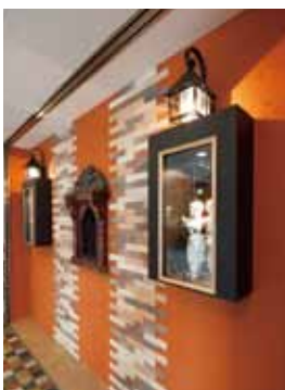
■ 飾り窓 (外側) 飾り窓に照明を仕込むことでアイキャッチ効果を持たせています