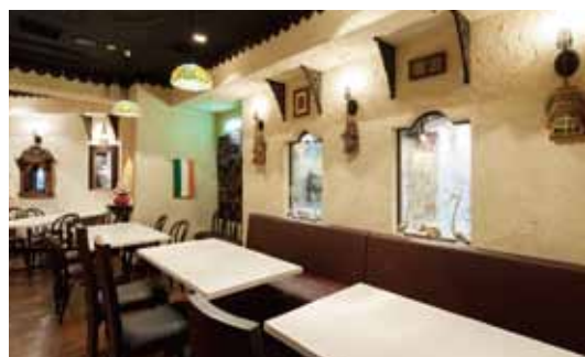
■ ホール 粗い質感の壁と昔ガラスの出窓が調和して素朴な雰囲気に