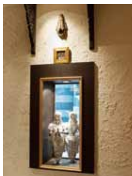
■ 飾り窓 (ホール側) 飾り窓はインド製の小物とあうような色味を微妙に調整しています