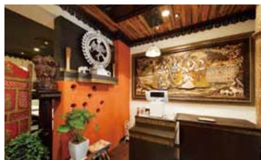
■ レジ 精緻な木彫画を飾りインドらしいエキゾチックなイメージをプラス