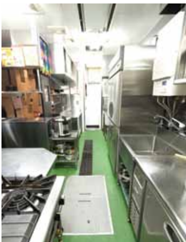
■ 厨房 冷蔵庫を挟んでシンクが3つと調理台も奥行き80cmと深く取ってあるから使い勝手抜群です