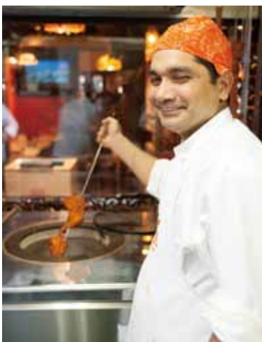
■ タンドール ベテランのインド人シェフも使いやすいと太鼓判を押すほど優秀な日本製のタンドール窯を採用