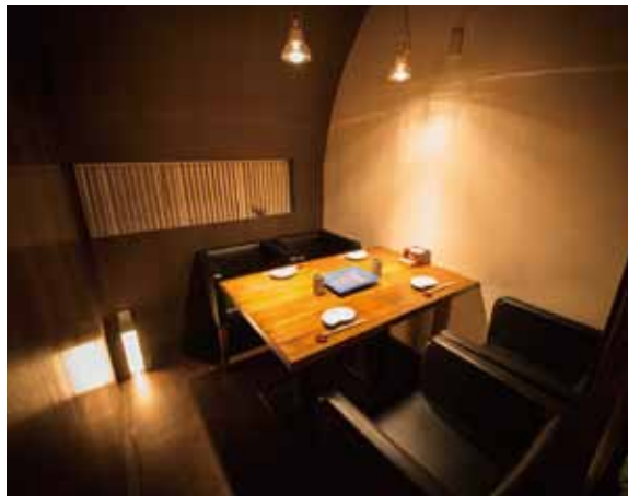
■個室 4名用の個室を2室用意。穏やかな照明でシックな雰囲気