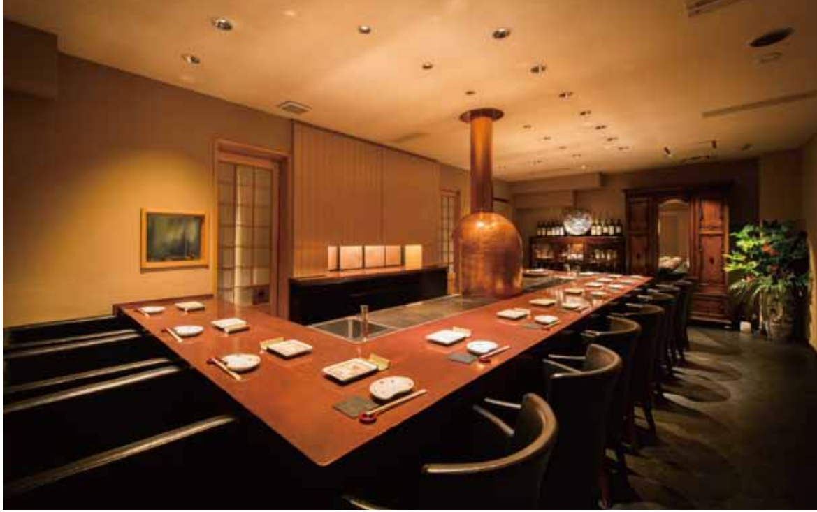
■オープンキッチン パリ支店にも同じ仕様のものが据えられるほど、使い勝手のいい銅製打ち出しのフライヤーカバー