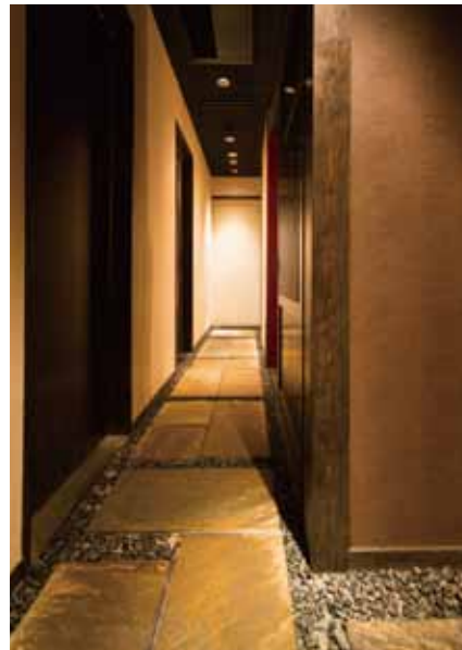
■個室への渡り廊下 砂利や飛び石を配して和の情緒を醸し出す