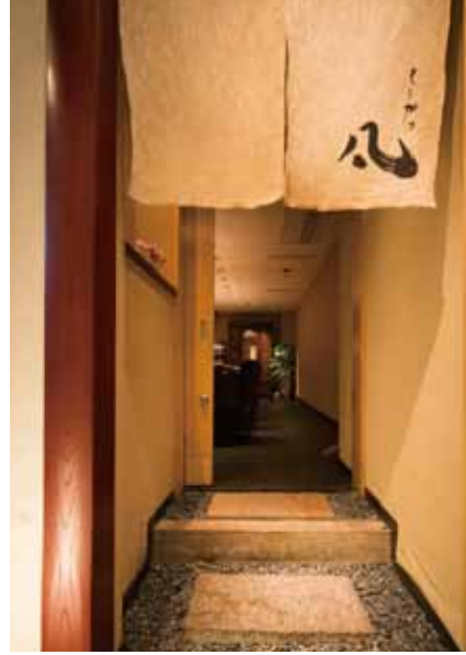
■エントランス 暖簾をくぐり、飛び石佐いに店内へ