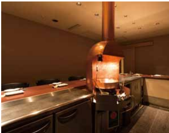
■キッチン お客様へ目配りが効くようにくると見渡せる造りに