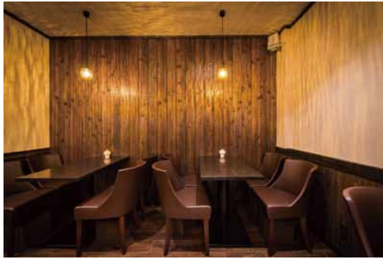
■ テーブル席 シックなブラウンが高級感を醸し出しています。身体を包み込むデザインのイスを採用