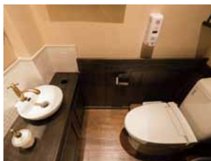
■ トイレは水回りにタイルを配し耐久性を向上