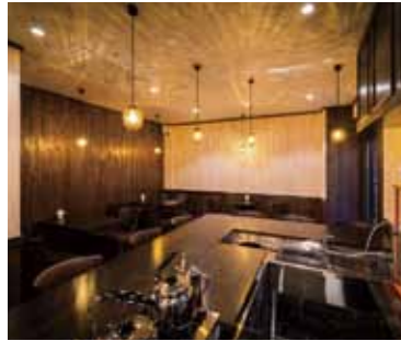
■ 店内 カウンター内から死角がないようレイアウト