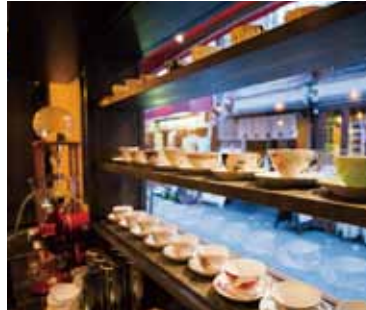
■ 飾り棚 ロイヤルコペンハーゲンやマイセンのカップ