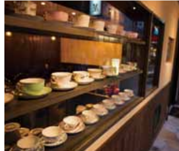
■ 飾り棚 (外から) ディスプレイで珈琲専門店である事をアピール