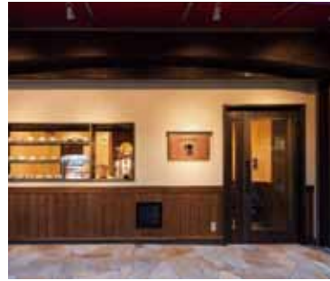
■ 外観 シックな色合いでまとめて高級感を演出