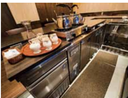
■ キッチンスペースはコンパクトに機能を集約