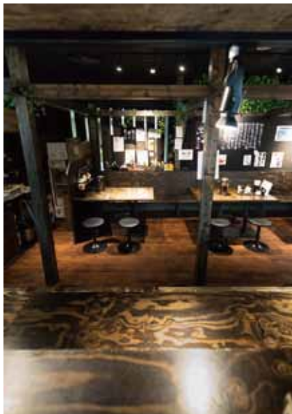
■厨房からテーブル席 厨房から店内全席が見渡せるようにレイアウト