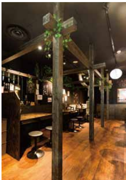
■ホール 導線を阻害せずホールにアクセントを与えるよう工夫