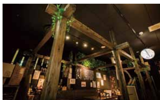
■ホールに柱・梁組みで空間をダイナミックにデザイン