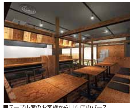
■ テーブル席のお客様から見た店内パース