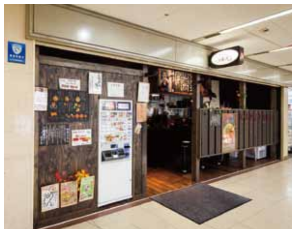
■外観 キッチンの活気が伝わる低めの目隠し扉で、お客様を呼び込む店作り