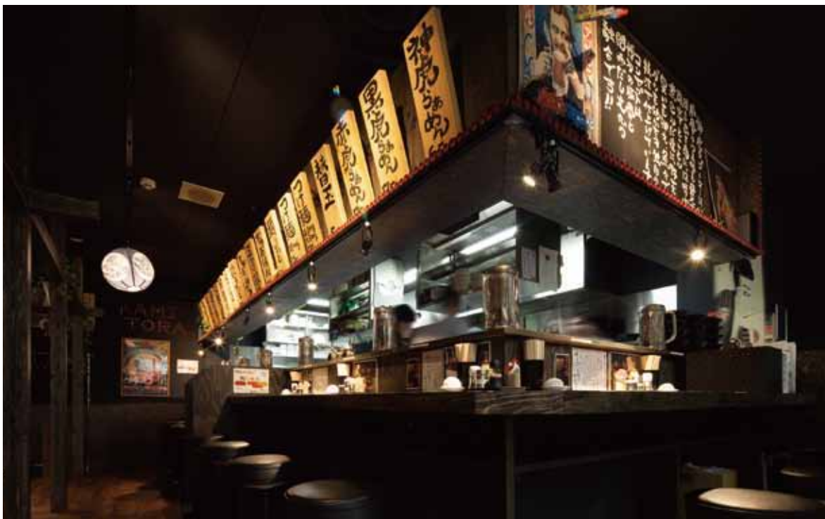
■ホールからカウンター席 キッチンにそってL字型に組まれたカウンター。ラーメン店のウリは一人客への即応性ゆえ、キッチンとカウンターが近いほど効率が良い