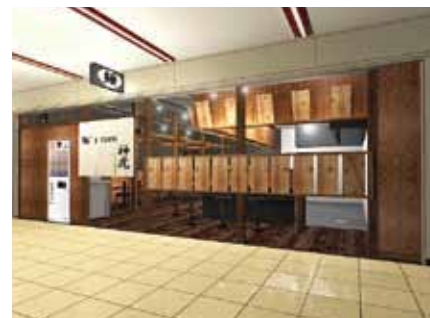
■実際の環境を再現して周辺との調和もチェック