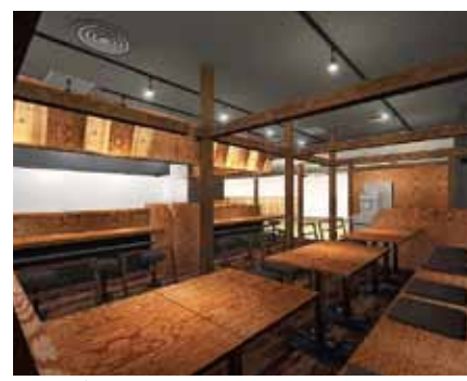
■テーブル席のお客様から見た店内パース