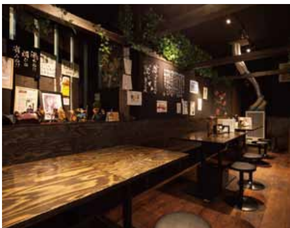
■テーブル席 グループやファミリーなど複数名で利用されるお客様のためのテーブル席