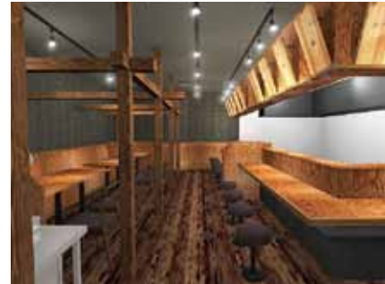
■色合いを実物より明るくし、木目を強調して提案