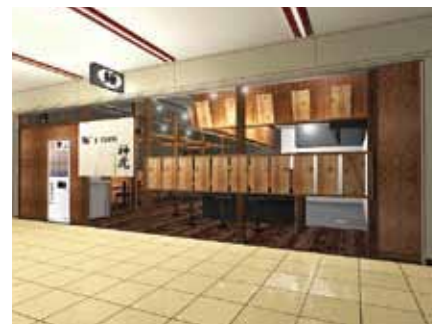
■ 実際の環境を再現して周辺との調和もチェック