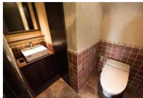
■ 素朴な素材感のタイルが全体の雰囲気にもマッチしたトイレ