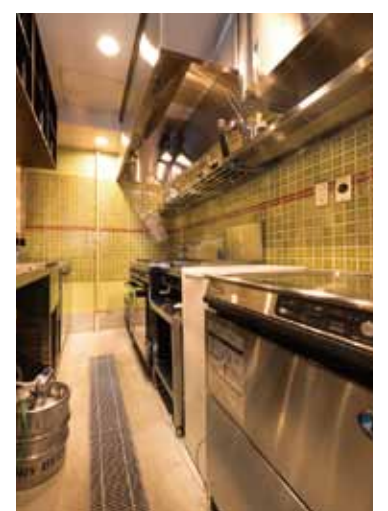
■ 機材の張り出し面をすっきり揃えることで、スタッフがスムーズに行き交えるように配慮