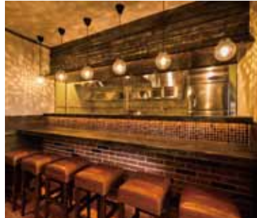
■カウンター席 キッチンの活気を感じつつ、食事が楽しめます