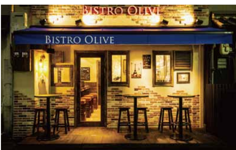
■ 店舗の表にオープンテラスを設け、集客力のある雰囲気を演出します