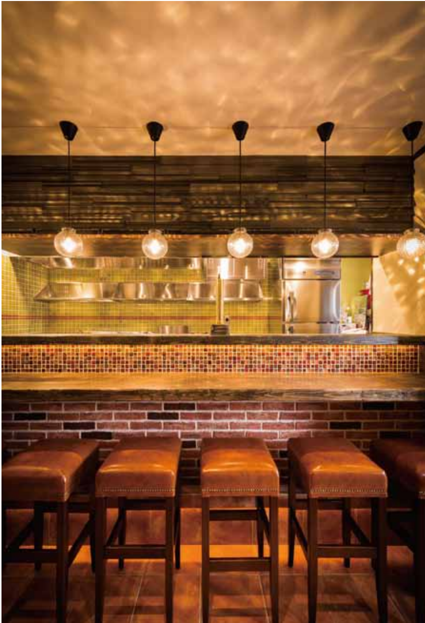
■カウンター席 ランダムに光を投げかけるレトロな照明が食事の楽しさを演出