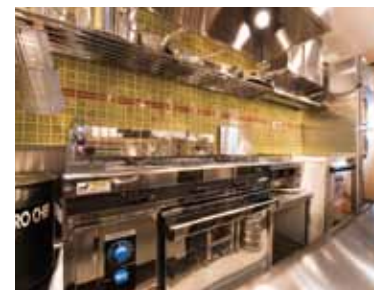
■ 作業面を揃えるため、バスタパン用コンロと調理用のコンロは高さを変えて設置。