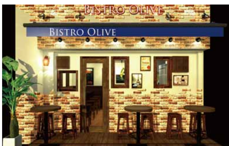
■ 実際の店舗をイメージしやすい精彩なパースにより最終イメージを正確に提案