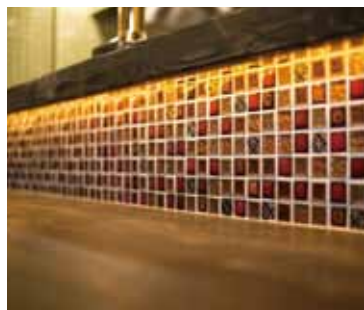
■カウンター ランダムカラーのタイルで、暖かみを演出