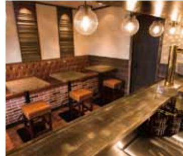
■キッチンから客席への眺め キッチンから客席が見渡せるのがポイント