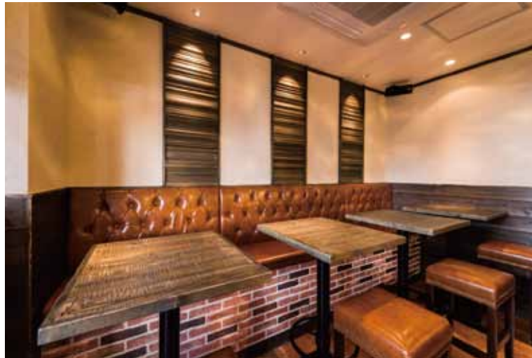
■テーブル席 椅子はクッションの効いたハイソファとハイスツールで座り心地を確保