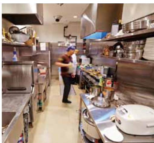
■ 空間をゆとりと使い、働きやすい動線を確保したキッチン