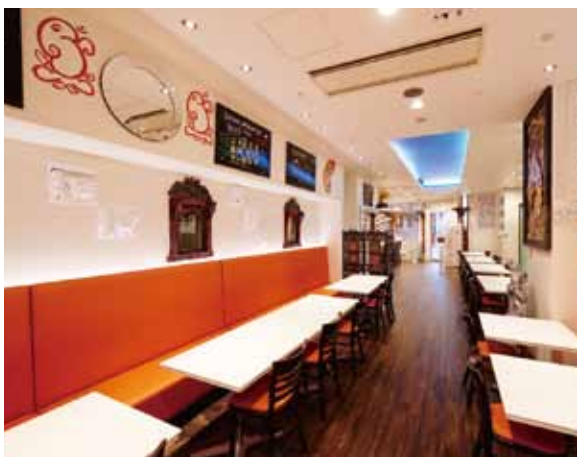
■ テーブル席 イメージカラーのオレンジをメインにシンプルにまとめたテーブル席