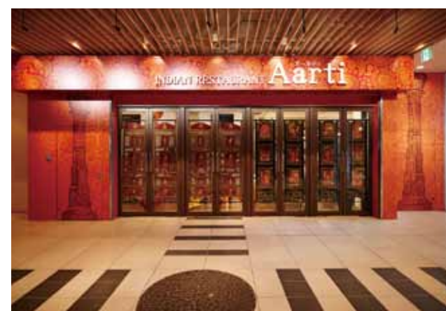
■ ホールに面してエキゾチックな工芸品が目目を惹き本場の雰囲気を伝える