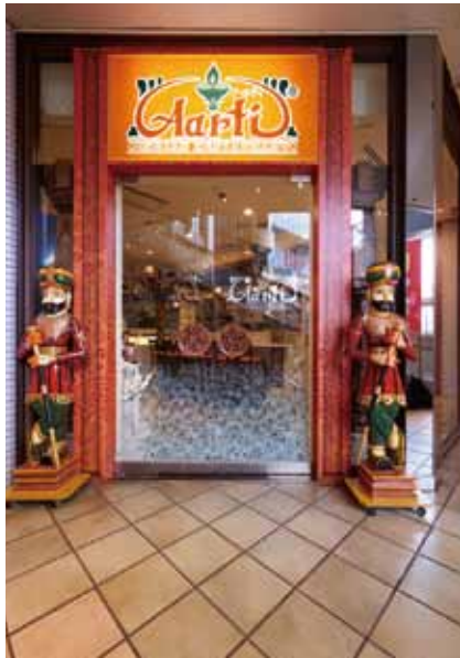
■ エントランス 木彫りのインド衛兵がうやうやしく迎える