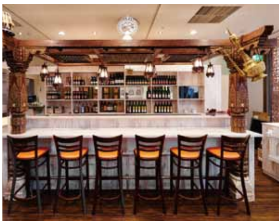
■ カウンター席 エントランスから最も目を惹くカウンターはインドらしく演出