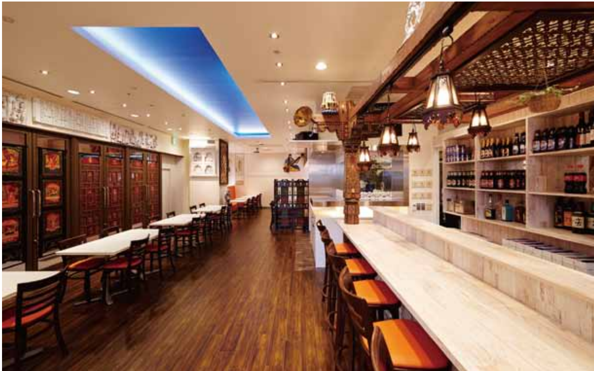
■ エントランスからホール アールティでは今までにない白い空間に本場インドの空気を漂わせるデコラティブな装飾が映える