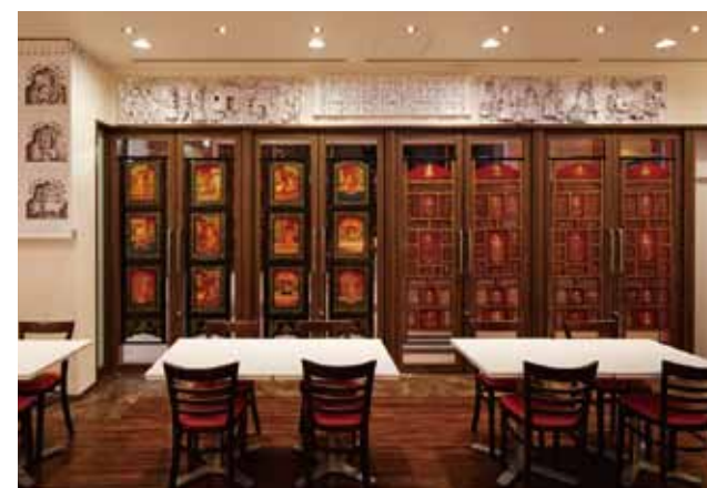
■ 高い天井と木彫りの繊細な工芸品が高級感を醸し出す