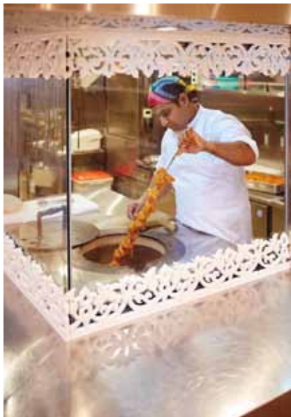
■ タンドール シェフが焼き上げる様子がホールから見えるのが魅力