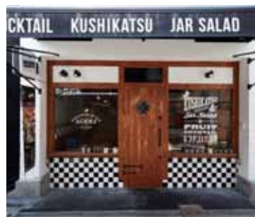
■エントランス ハワイのサーフカフェをイメージしてデザイン