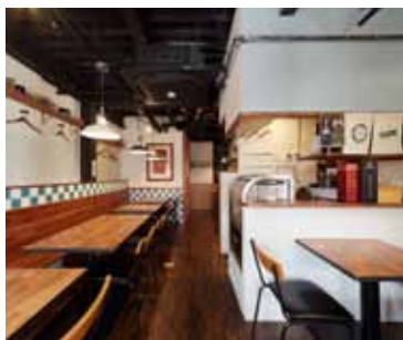
■ホール モザイク調に配されたタイルが印象的