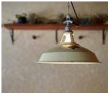
■ペンダントライト ナチュラルな印象を演出するエージング加工