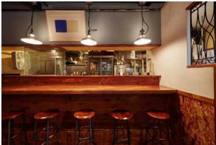
■カウンター席 串カツのフライヤーは耐熱ガラスで囲い、熱や油ハネがカウンター席に届かないよう配慮