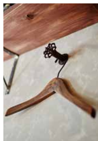
■ハンガーフックにも小技を効かせる