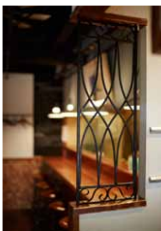
■アイアンの透かし格子が印象的