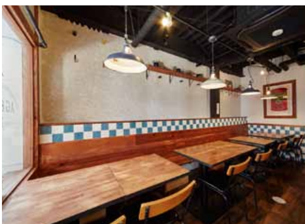
■テーブルを寄せたり、離すだけで様々な人数のグループにも対応