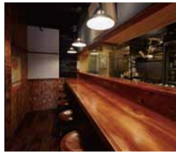
■カウンター お客様との距離感がぐっと縮まるカウンター