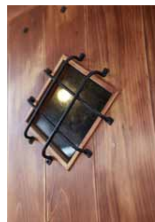
■エントランスドアは小窓がアクセント