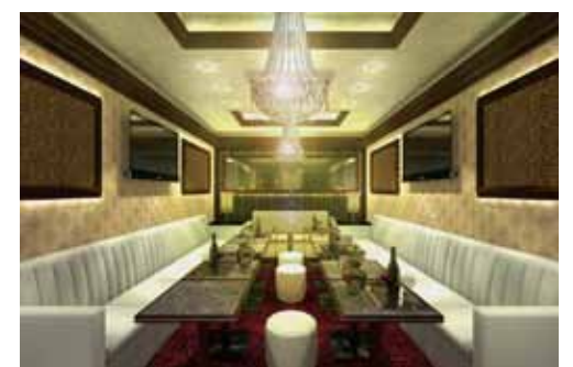
■ VIPルーム-3のイメージパース