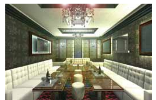
■ VIPルーム-2のイメージパース