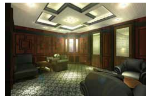
■ ウェイティングスペースのイメージパース