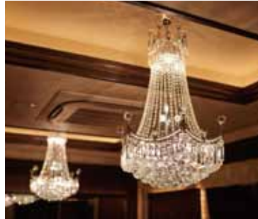
■ VIPルーム-3 各VIPルームごとに異なるテイストで演出