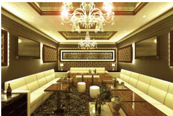
■ 実際の店舗をイメージしやすい精彩なパースにより最終イメージを正確に提案