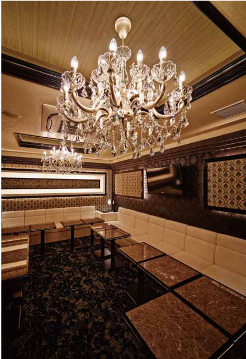
■ VIPルーム-1 煌めくような光を投げかける豪華なシャンデリアが贅沢なひと時を演出