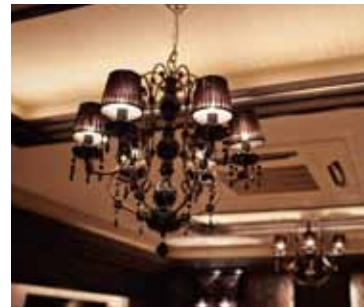
■ VIPルーム-2 シックな光を投げかける個性的なシャンデリア