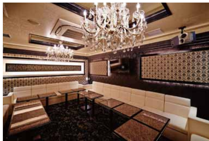
■ プレゼンテーションで提案したイメージ通りに丁寧な施工で空間作りを現実化