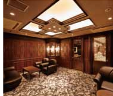
■ VIPルーム・ウェイティングスペース 英国のクラブを思わせる重厚な佇まい