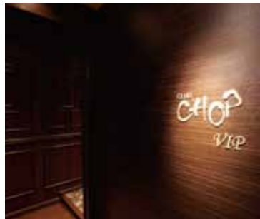
■ 本館エントランス スポットで店名が印象的に浮かび上がる