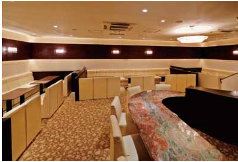
■ 本館ホール ボックス席とボックス席の空間をしっかりとってプライバシーを確保している