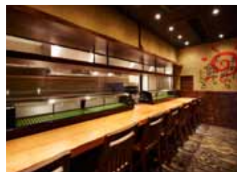
■カウンター席 奥行きも広く料理を数品並べても余裕