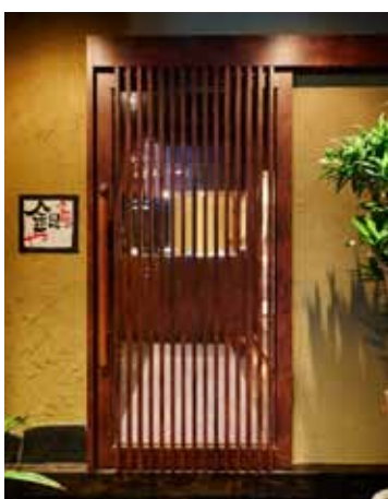
■透し格子から店内の賑わいがうかがえる