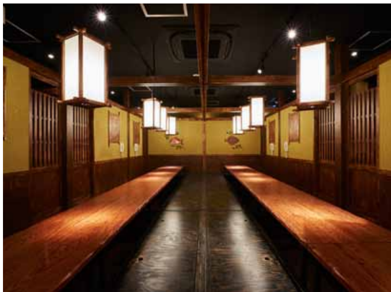
■大座敷 仕切りを取り払うことで大宴会場としても使える座敷スペース。掘りこたつスタイルで居心地抜群