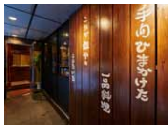
■エントランス アプローチではコンセプトを手書きで表現