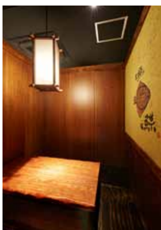
■座敷を仕切ればデート仕様の個室に