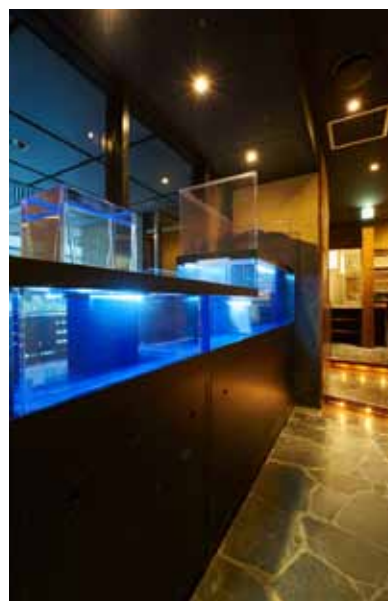
■生け簀 外からも見える生け簀で鮮度をアピール