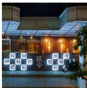
■魚偏のボックスサインで鮮度をアピール