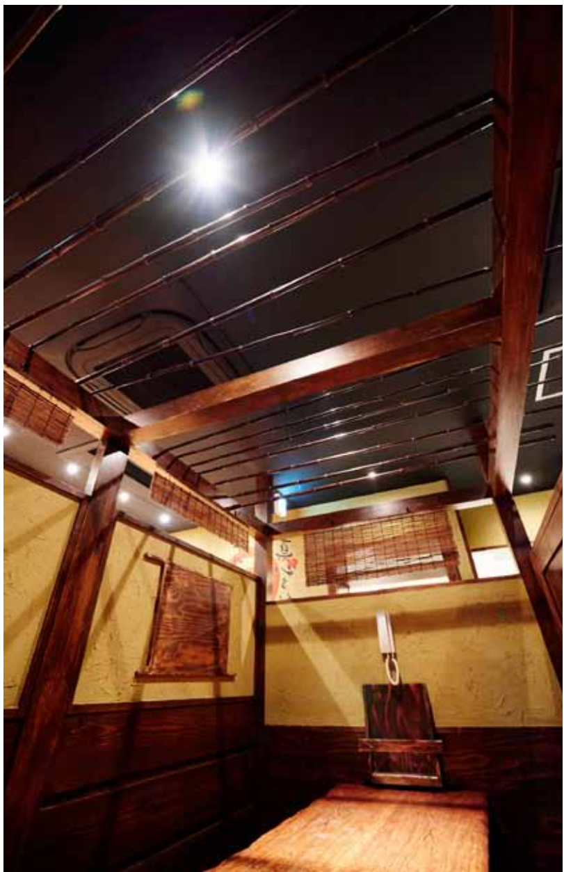
■ボックス席 半個室となっているボックス席。素朴な雰囲気を出す粗く塗られた珪藻土の壁面が印象的