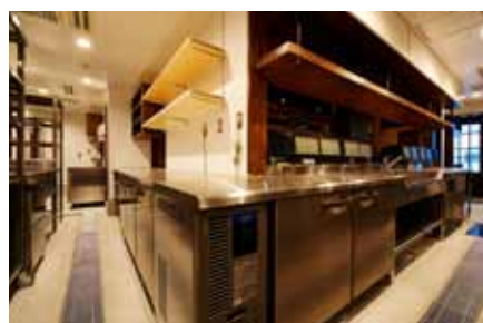
■L字形にレイアウトされた作業効率の高いキッチン