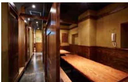
■小規模な宴会なら充分対応可能なボックス席