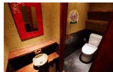
■トイレも素朴な銀やテイストで統一