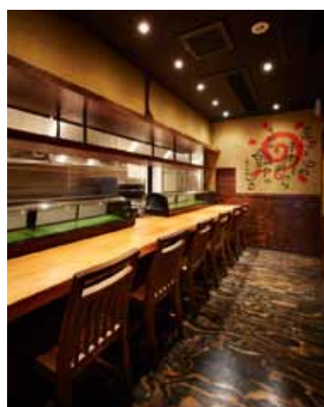
■重厚感のある一枚板のカウンター