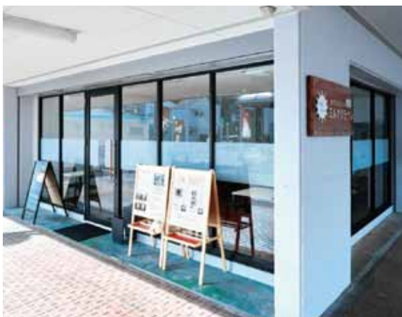
■ エントランス 春先にはテラスにも椅子やテーブルを出して集客力アップ