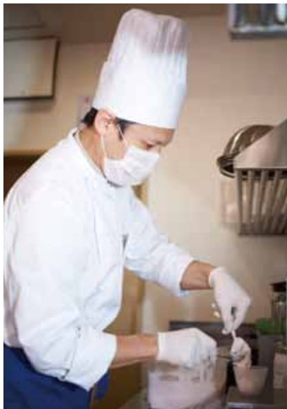
■ キッチン ツールが手に取りやすいようレイアウトされています