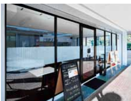
■ 開放感のあるエントランスが集客力を高める