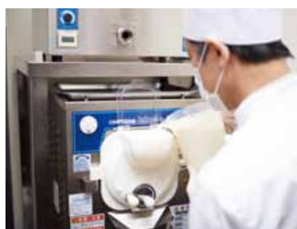
■ ジェラートマシンはキッチン奥にレイアウト

Total Kitchen SENDA Tel:06-6632-5851 (代)