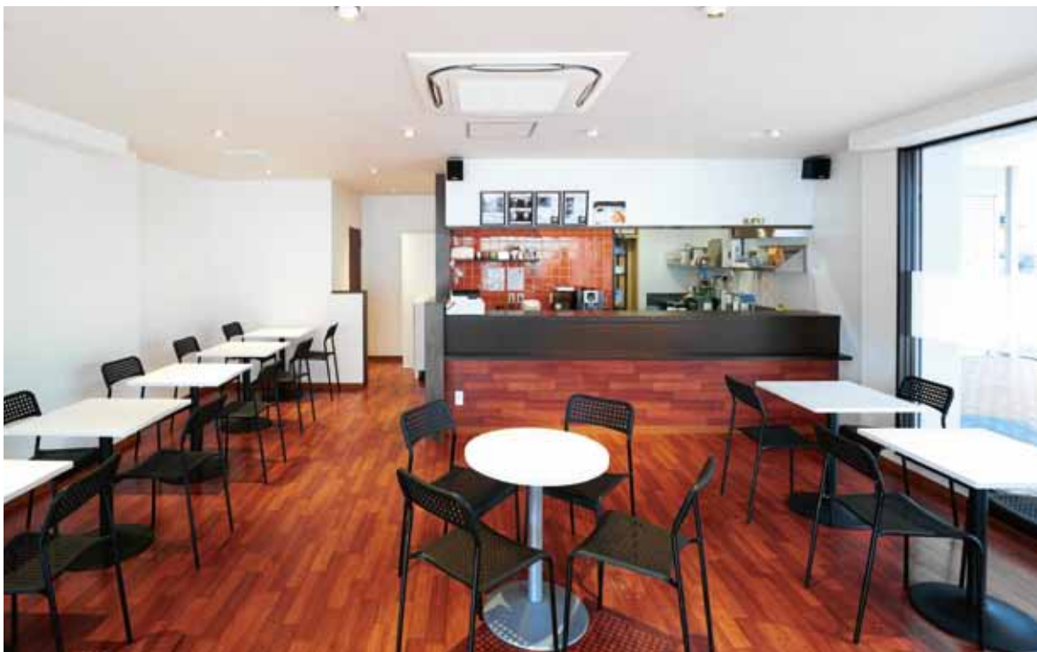
■ エントランスからホール レイアウト変更のしやすい軽い椅子とテーブルでコミュニティ内の多彩なミーティングに対応