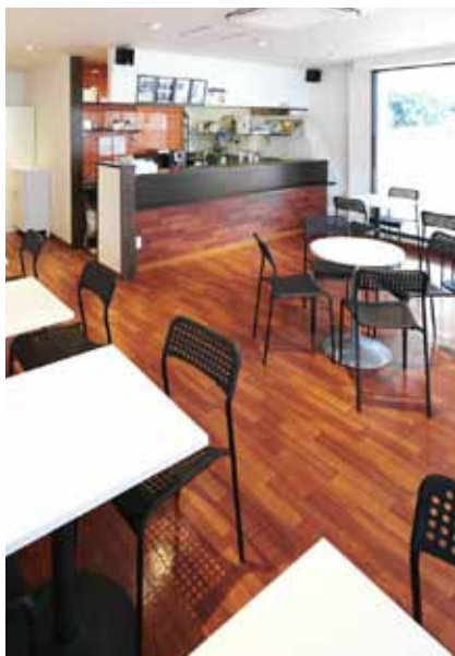
■ ホール 深い色合いのフローリングが落ち着いた印象を演出