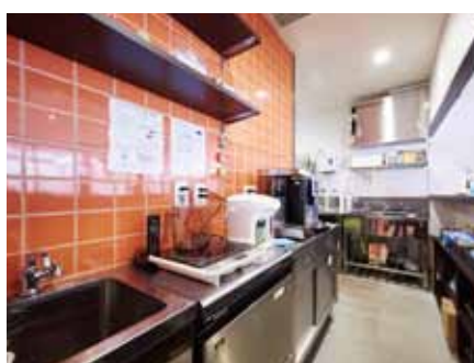
■ 効率的にツールが配されたキッチン