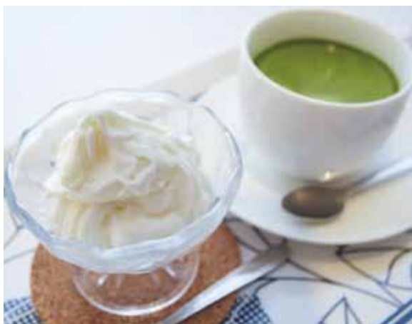
■ ジェラートセット 陽光が射込む開放感のある空間ゆえ、ジェラートの印象もより華やかに