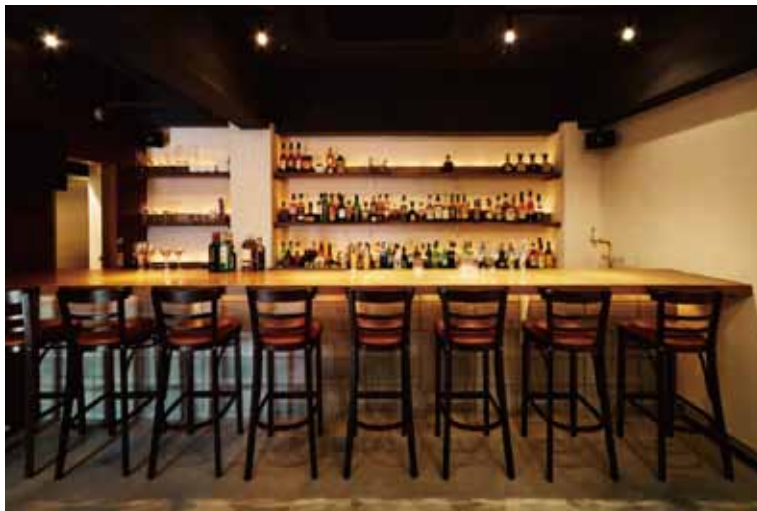
■ホール ガレージ感を出すために、床や壁はラフな塗装で仕上げて無骨な印象を演出