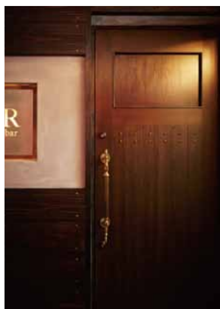
■重厚感と高級感を併せ持つエントランス