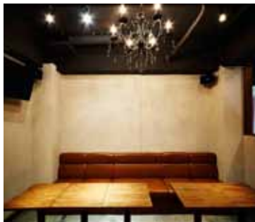
■ソファ席 シャンデリアを設置してシックな雰囲気に