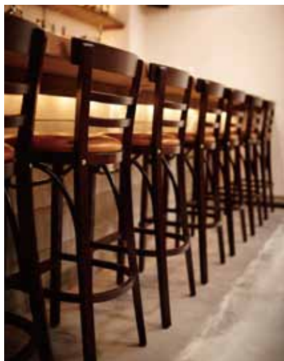
■お客様の話しも弾む軽めのハイチェア