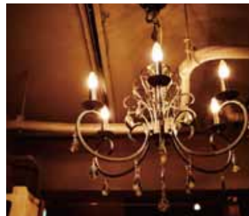
■シャンデリア アクセントになるゴージャスなシャンデリア