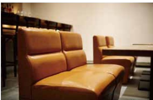
■ソファは施主様の希望で高級感のあるエルメスカラーに