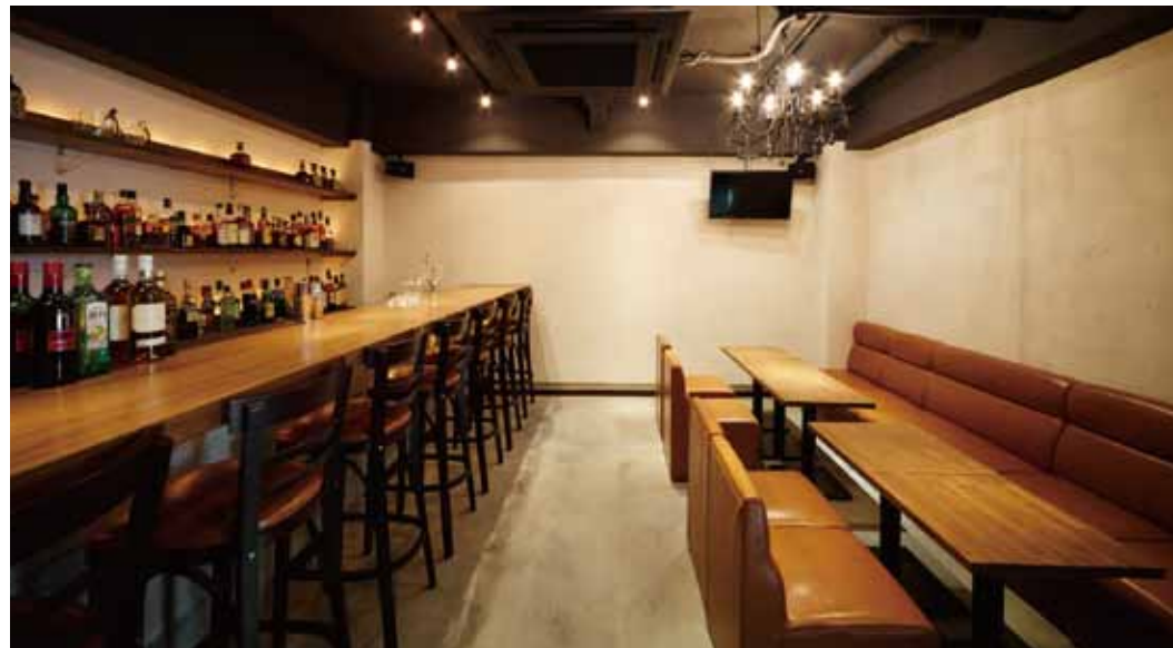
■天井は取外し可能なマットブラックに塗装し、圧迫感を軽減