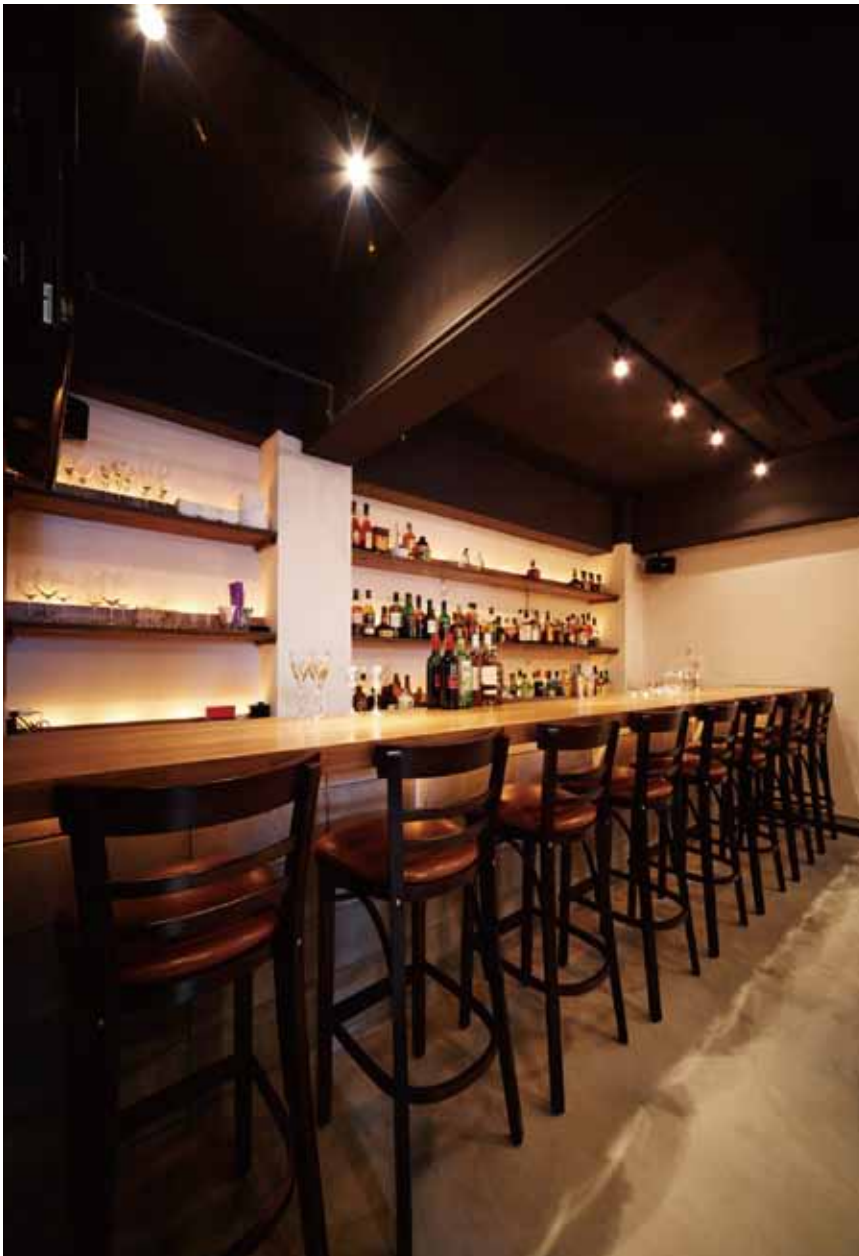
■カウンター ブロックを積み上げた上に一枚板のカウンターを設置することでハードボイルドなタッチを表現