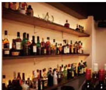
■カウンター奥 スタッフの身長を考慮し使い勝手良く設置