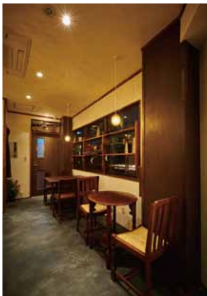
■テーブル席 窓際には飾り棚をレイアウトし、レトロな雰囲気に