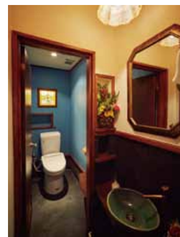
■レストルームの壁紙は明るい空色にすることでお客様の気分を切り替える