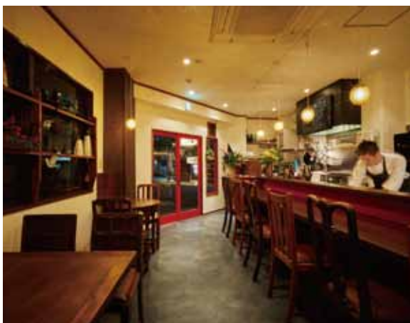
■ホール カウンターとテーブル席の間をゆったりとってスタッフの動線を確保