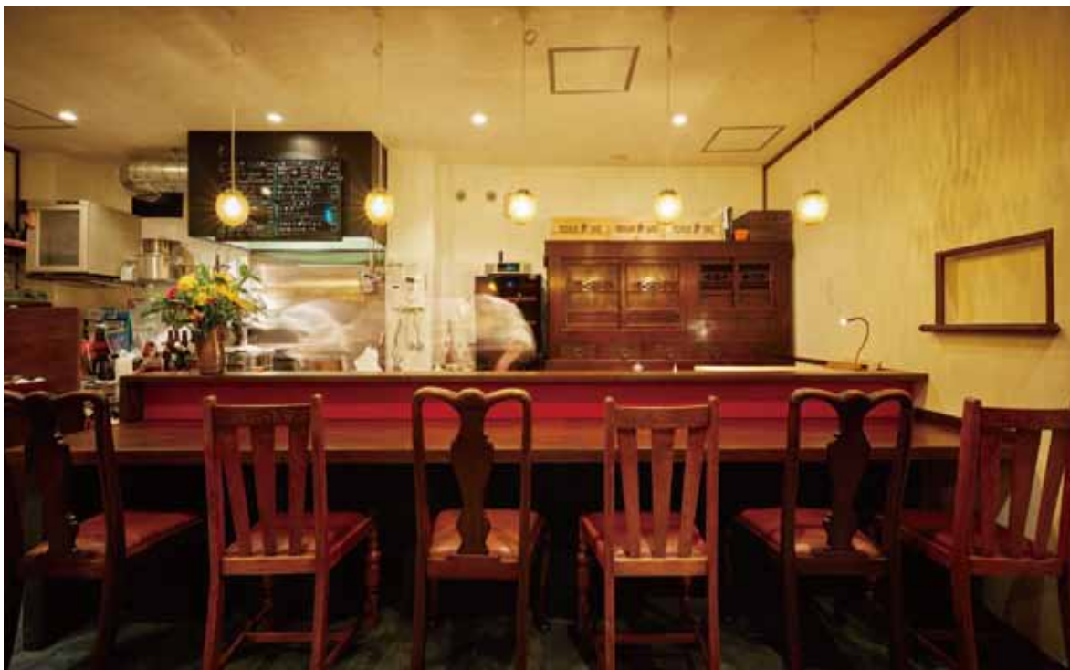
■メインカウンター アンティークの椅子に合わせたハイカウンターにははっきりと木目が出たタモ材を使用。家具の色味に合わせて丁寧にペイント