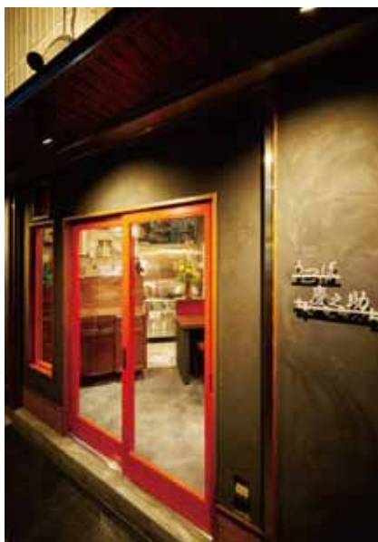
■エントランス マットな質感の壁面にシルバーの立体ロゴが映える