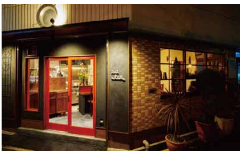
■ロートアイアの金物を壁面に配することでハードでありながら格調高い表情に