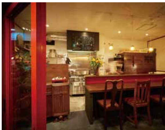
■エントランスより 開き戸と共色であしらったカウンター立ち上がり差色で効いている