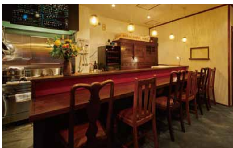
■床面は刷毛跡を残した粗い塗装仕上げでノスタルジックな雰囲気に合わせる