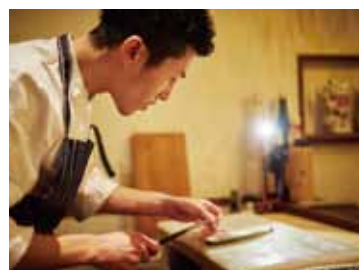
■繊細な包丁さばきができるようオーダー通りに作業スペースを確保