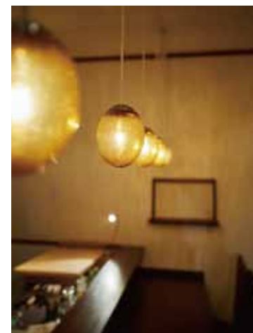
■気泡が入ったアンバーカラーのランプシェードが陰影のある影を投げかける