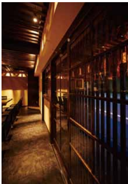
■エントランスを内部より 格子を巧みに使い艶のある趣とグレード感を醸し出す