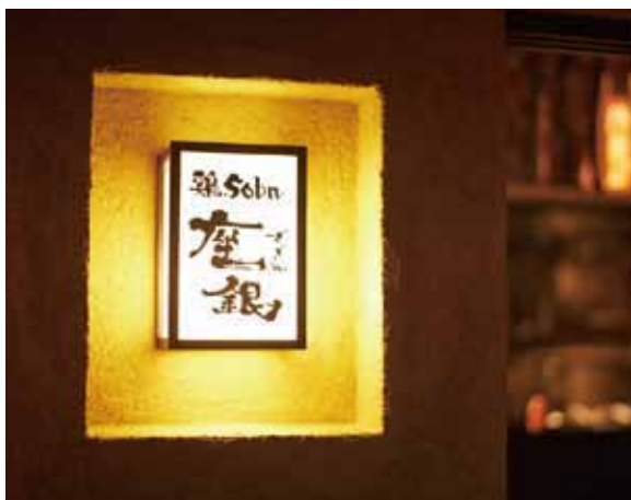
■ サイン 上質感のある外壁の質感を際立たせる和の風情あふれるサイン