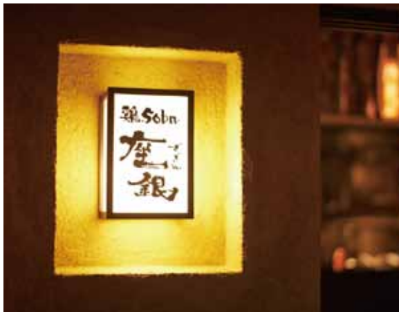
■サイン 上質感のある外壁の質感を際立たせる和の風情あふれるサイン