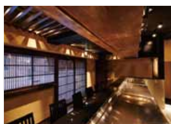
■ 使い勝手を考え、キッチンから店内隅々にまで目が届くようにレイアウト