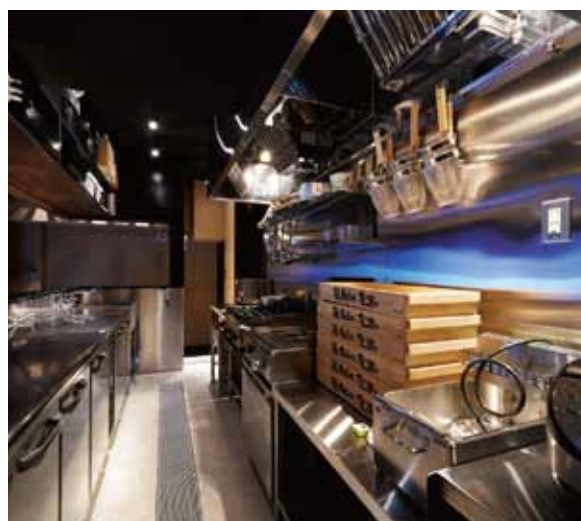
■ 動線を充分にとった動きやすいキッチンスペース