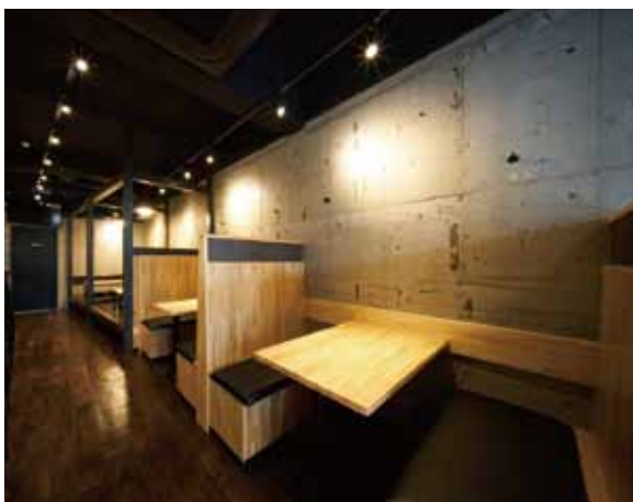
■ テーブル席 スツールの下は上着などを入れられる物入れになっています