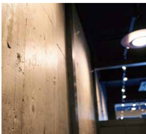
■ ラフな仕上げの打ちっ放しの壁がシックな雰囲気を演出