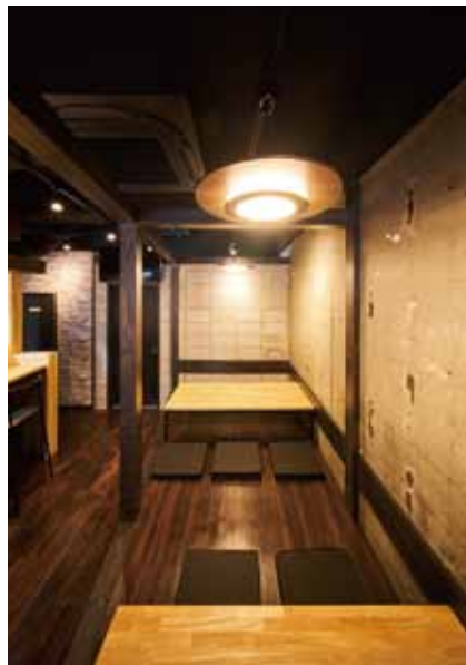
■ 座敷 手前は4人掛け、奥は6人掛けの小上がりに