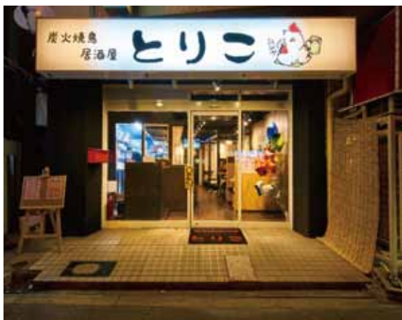
■ 外観 お客様を呼び込む、親しみのあるイラストが描かれた大看板