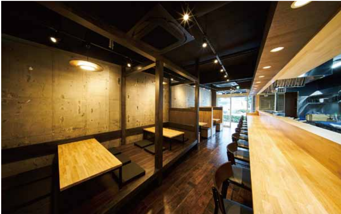
■ ホール 気軽にカウンターに、宴会に活躍する座敷席、そしてファミリーにぴったりなテーブル席と多彩なお客様に対応したレイアウト