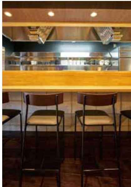
■ ハイカウンター ナチュラルな色合いの天板で明るい印象に