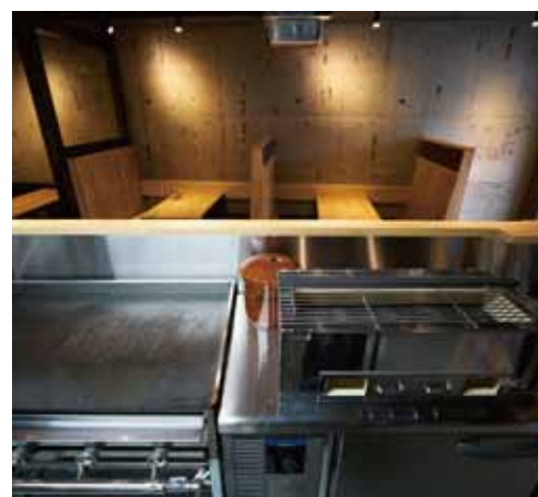
■ 火加減を一定に保てるIHや電熱焼鳥機をチョイス