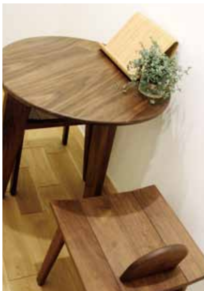
■ カウンセリングルーム お客様と親密になれるようにクローズドな空間に