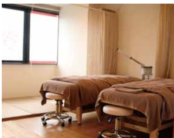
■ 施術ベッド カーテンで個々のベッドを仕切れるのでプライバシーの確保もOK