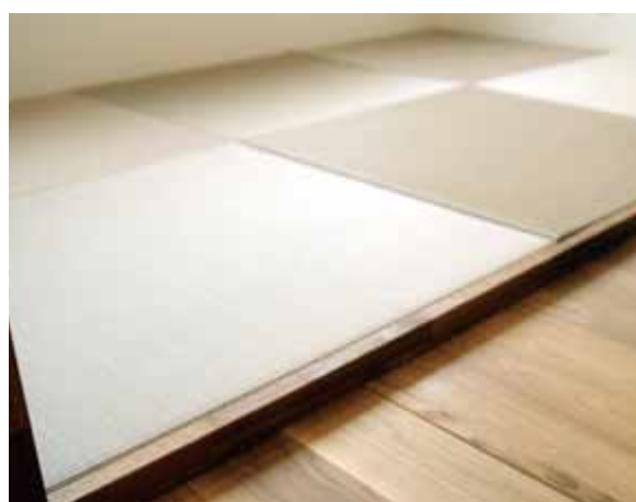
■ 畳ルーム 縁がなく、正方形の琉球畳ならモダンな空間ともコーディネートできる