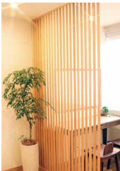
■ 施術後化粧台 自然光で肌の質感を確認できるよう窓際にレイアウト