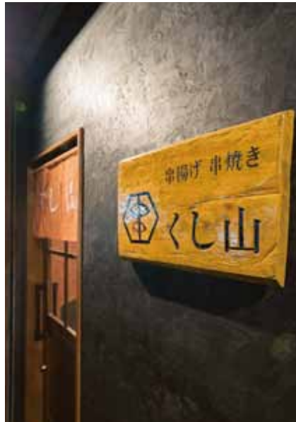
■ エントランス脇のサイン 上品にエイジング加工をした木材にロゴをレイアウト