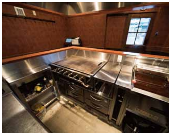
■ オープンキッチン 串揚げ用のフライヤーと串焼き用の鉄板を作業効率を考慮してレイアウト