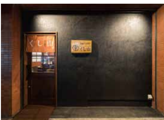
■ 来店者の期待感が盛り上がるようにダウンライトで華やかに