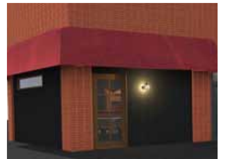
■ レンガ張りのビル外観と調和するよう色彩を設計