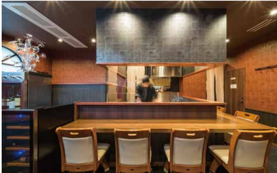
■ エントランスより 入口より入ると目に入るのは店主井之口さんがきびきびと調理しているオープンキッチン。活気あふれる雰囲気心が弾む