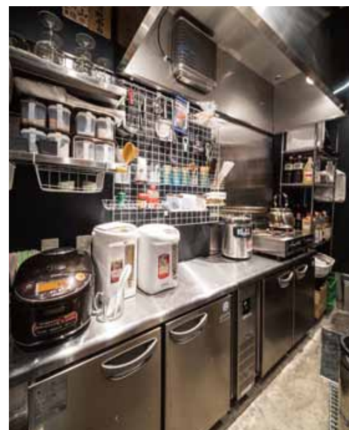
■ 使い勝手よくレイアウトされたインサイドキッチン