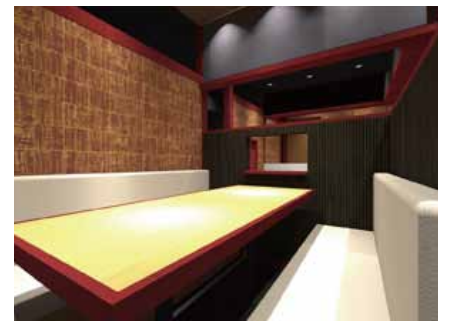
■ ボックス席奥の腰壁は最終的に凹状で施工された