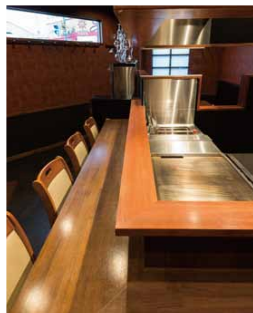
■ ダウンライトの光でカウンター上を華やかに演出