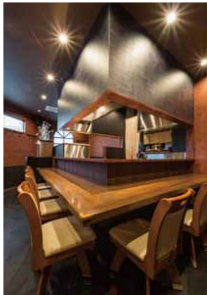
■ カウンター L字型のカウンターはキッチンから目が届きやすい