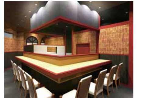
■ パースをベースに最終イメージを調整していく