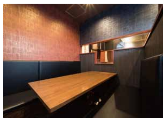
■ キッチンから配膳できるよう腰壁の一部を低くデザイン