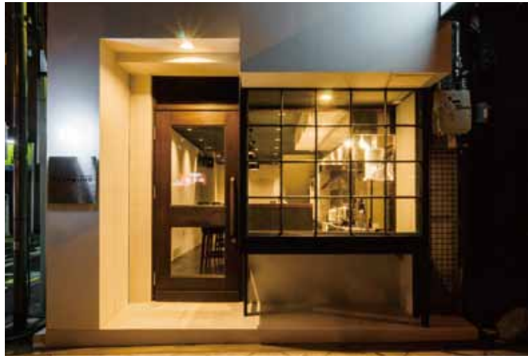
■ エントランス キューブをいくつか組み合わせたようなモダンなエクステリア