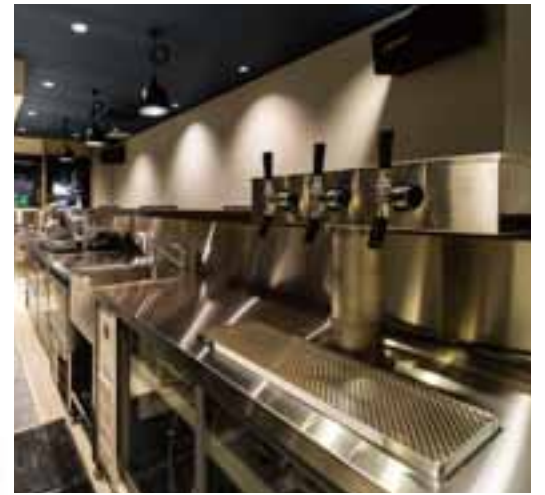
■ こだわりのクラフトビールを注ぐサーバー