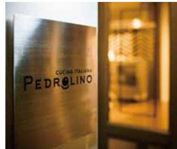
■ エントランスサイン ヘアラインのプレートに光をあて陰影を表現