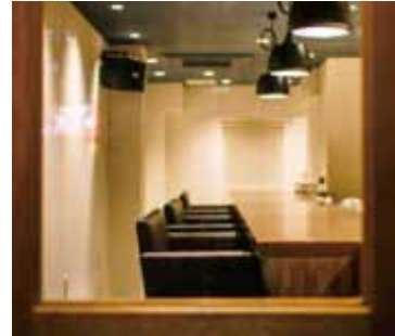
■ ドアの窓から 店内の賑わいがガラス窓を通して伝わる