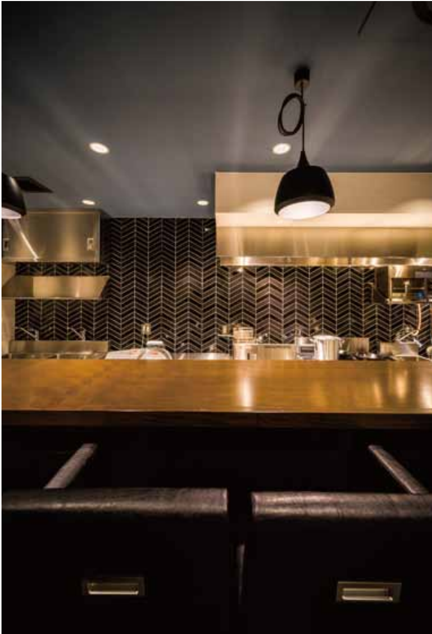
■ 1階カウンター 6m近い長いカウンターに6席と余裕を持って配しているのはゆったりとディナーを楽しんで欲しいから