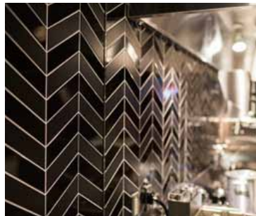
■ キッチン壁面 タイルの質感の違いがリズムを生み出す