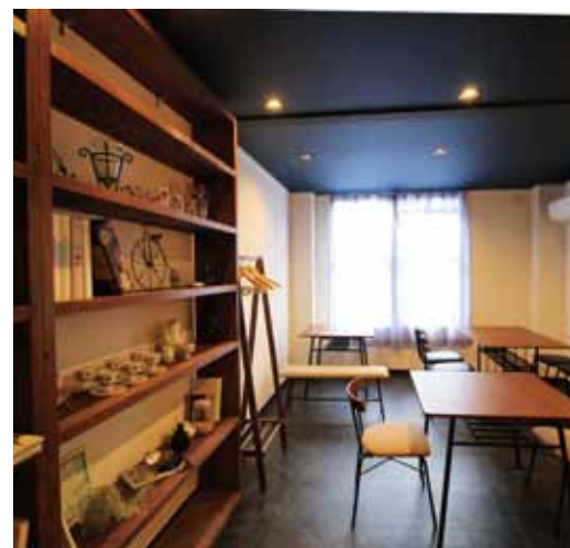
■ 1階奥の階段をのぼると2階のホールへ