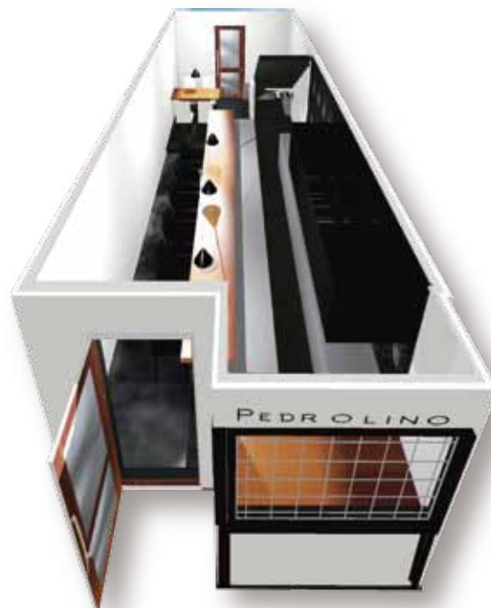
■ 1階のカウンター席と厨房のイメージを斜俯瞰の立体パースでわかりやすくプレゼンテーション