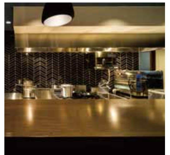
■ サラマnderや真空調理器材を機能的に納めたキッチン