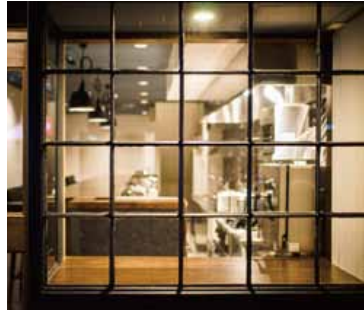
■ 出窓 出窓の棧の塗装を変える事でイメージを一新