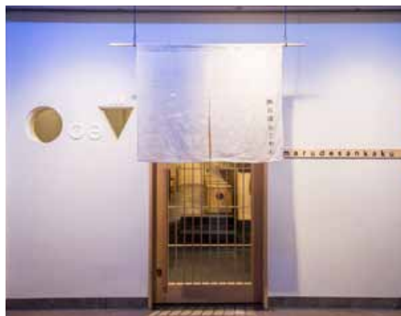
■エントランス 漆喰に白木の引き戸と外観はあくまでも和食店のような静かな佇まい