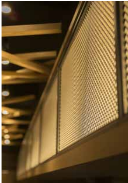
■カウンター上部照明 鯛のウロコをスチールパネルのパンチングで表現