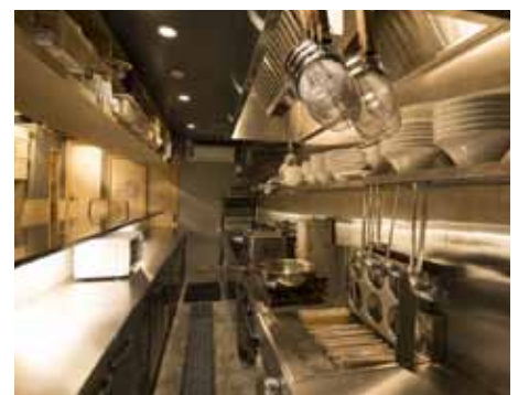
■スムーズに作業が進むよう調理器具を効率的に配置