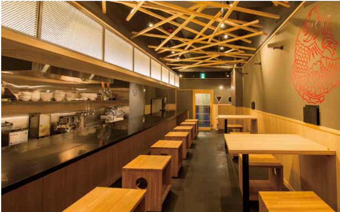
■カウンター席 懐の深い漆黒のカウンターがシックな印象を演出。ペアテーブル席側の壁面には踊るように跳ねる活きのいい鯛が描かれている