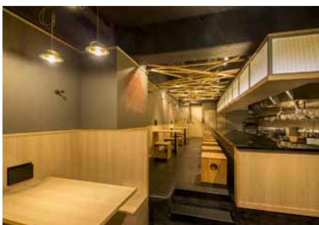
■エントランス左側には家族やグループ客に対応した4人掛けのボックス席