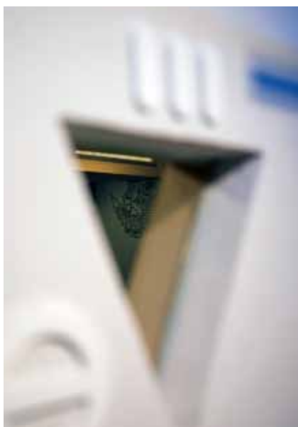
■飾り窓 飾り窓から見える光景に食欲をそえられる