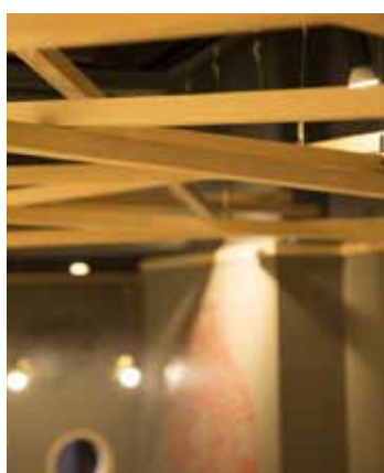
■ランダムな組木を天井に配し、ホールにリズムカルに陰影を落としている