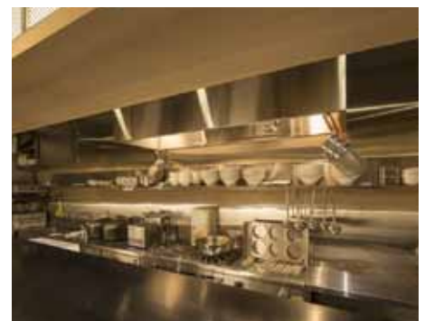
■清潔感が感じられるようステンレスで統一