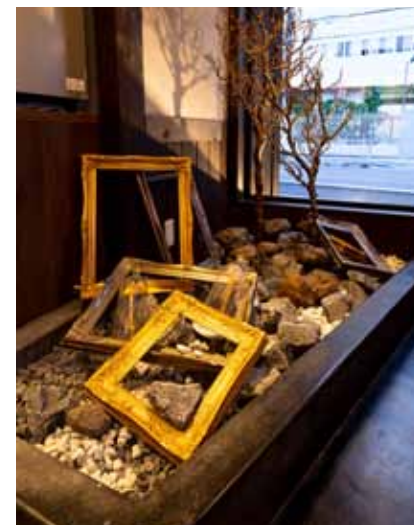
■非日常空間を演出する印象的なディスプレイ