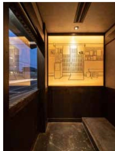
■エントランスには風除室と段差を設け、雨の日でも店内に雨水を持ち込まないように配慮