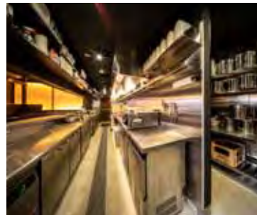
■厨房 導線を広くとった使い勝手のいい厨房