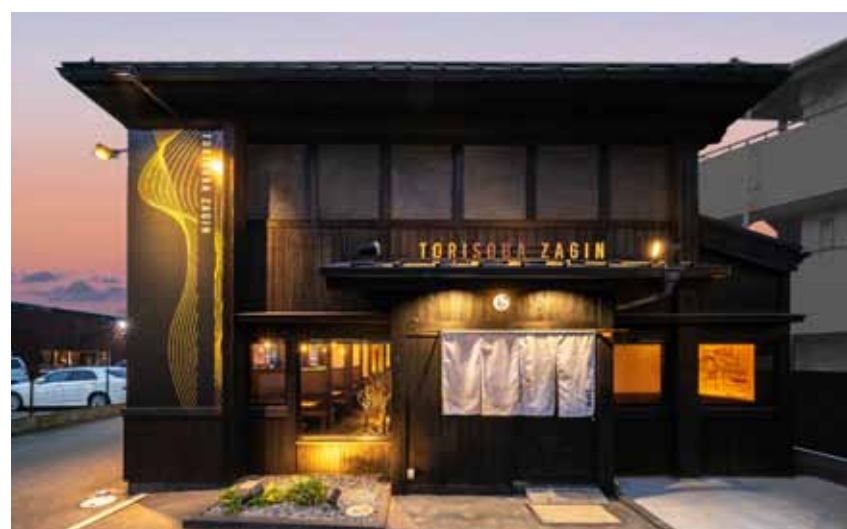
■料亭のような重厚感のある店構えで、これから味わうラーメンに対する期待感を盛り上げる