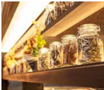
■ディスプレイ 出汁に欠かせない魚節がカウンター上に