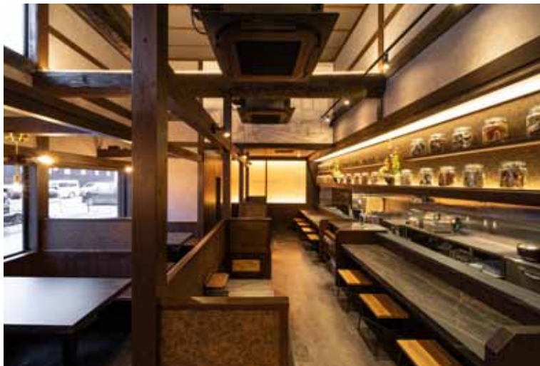
■ホール&カウンター席 ゆったりとしたカウンター席に、2人掛け・6人掛けのボックス席と様々なシーンに対応