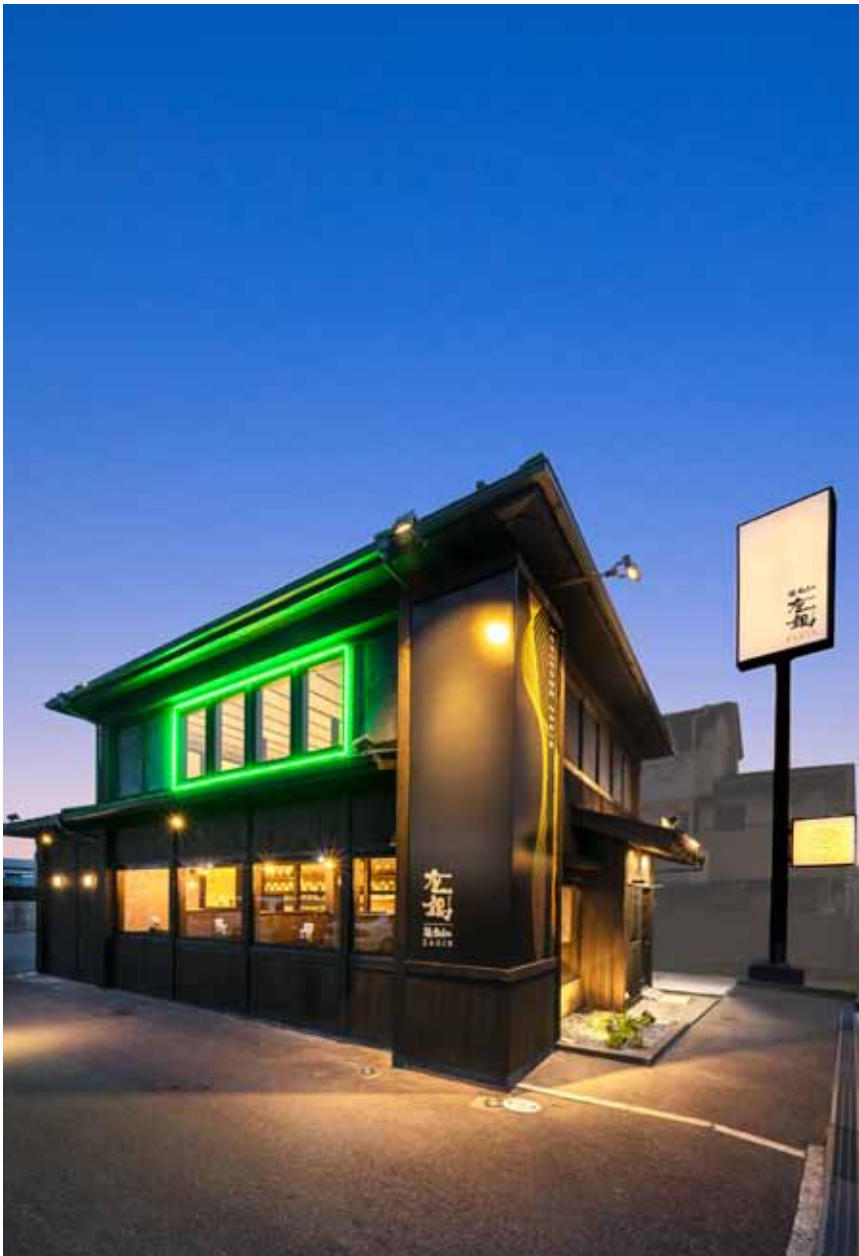
■エクステリア 交通量が多い大阪高槻線を通行する車にアピールする高さのある看板や壁面イルミネーション