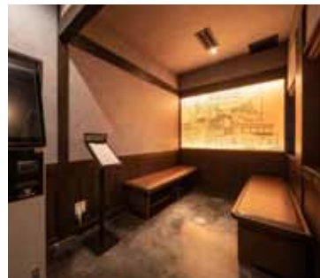
■ウェイトリングスペース ゆったりスペースをとって感染対策を