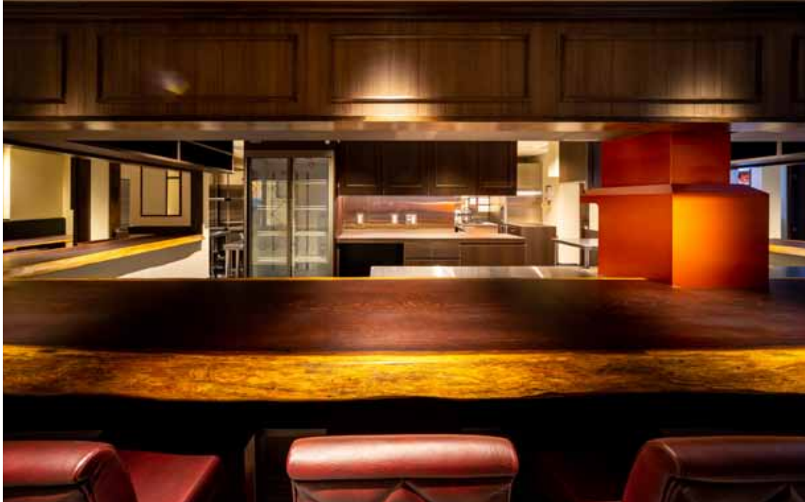
■ カウンター 強度や耐久性が高いウェンジの無垢板を使用したカウンター。この材は樹皮に近い部分は明るく、芯は黒紫褐色というツートンなのも魅力的