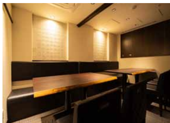
■ 個室は可動式の仕切りを収納すれば、10名収容の大きな個室に