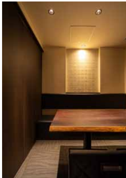
■ 個室 店内奥には4人掛け、6人掛けの2つの個室を完備