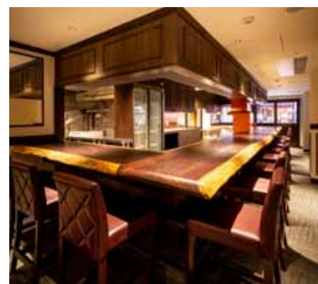
■ アクリル板を設置しても窮屈さを感じないカウンター