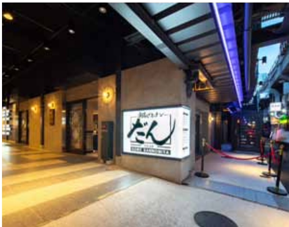
■ サインボード 最も人通りが多い海側の往來にインパクトのあるサインボードを設置