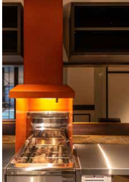
■ カウンターを厨房側から 本店と同様、橙色のフライヤーフードが印象的