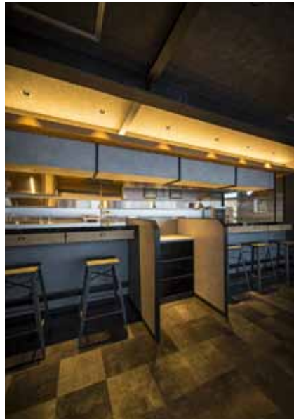
■ カウンター席 食事をゆったり楽しめるよう席は余裕を持って配置