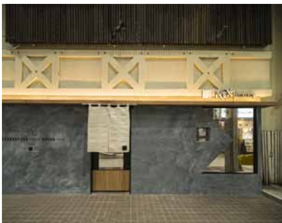
■ エントランス 質感が独特なジョリパット水墨仕上げの外壁が通る人々の目を惹きつける