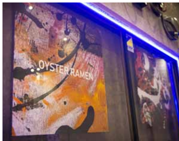
■ サイン 店内で映し出される映像とイメージを統一させたサインを設置