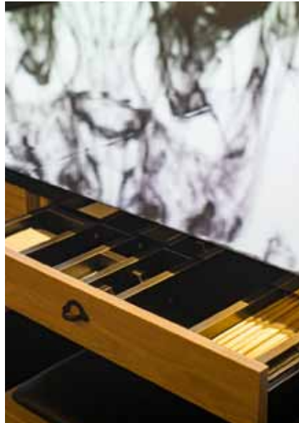
■ 各席の引き出し ペッパーミルや箸は各席の引き出しに収納