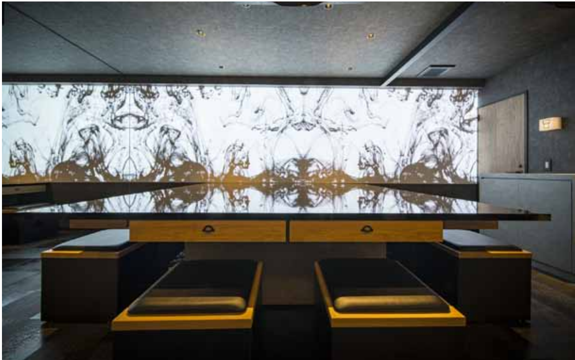
■ テーブル席 2台のプロジェクターで映し出された映像が鏡面のようなテーブルに映し出されて、よりインパクトのあるエンターテインメント空間に