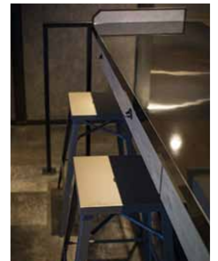
■ カウンターにはバーのようなハイスツールを使用