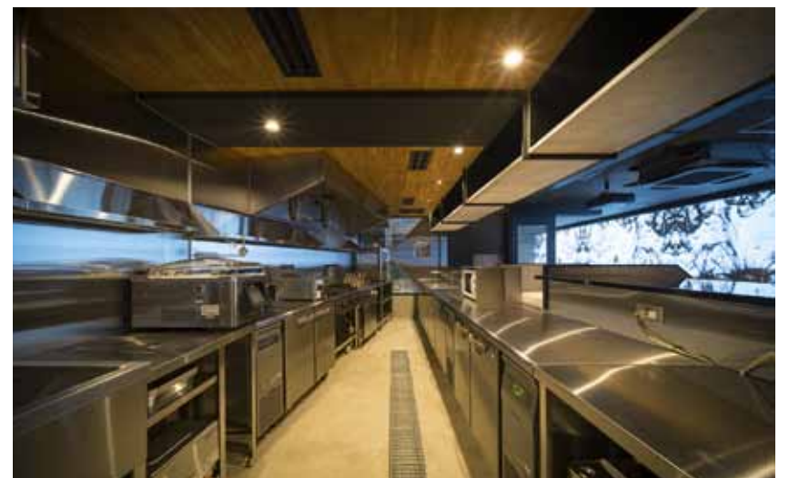
■ カウンター席からも厨房での作業が見やすいライブ感重視のキッチンレイアウト