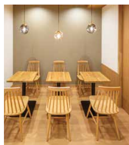
■ シンプル&シックな空間づくり