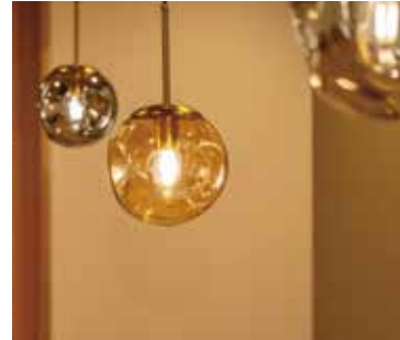
■ 照明 ニュアンスのある光が広がる照明がアクセントに