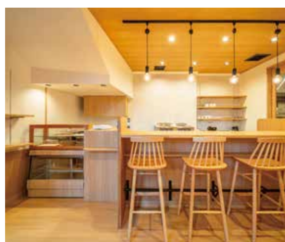
■ ハイカウンターは常連さんの憩いの場に