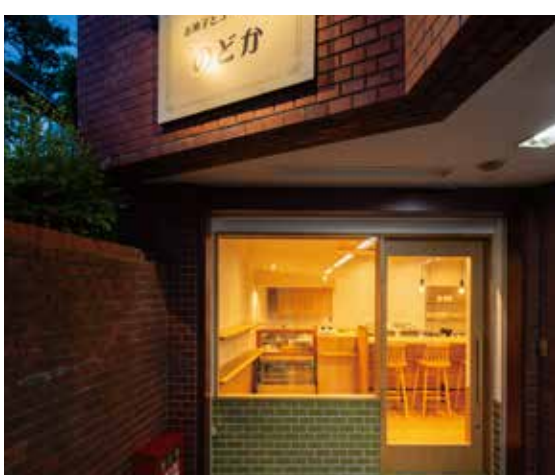
■ 温かみのある雰囲気がエントランスからもうかがえる