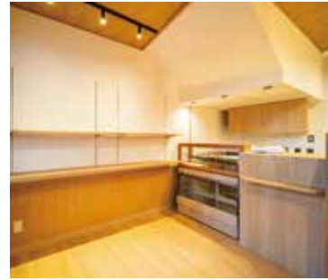
■ エントランス 焼き菓子をディスプレイできる物販スペース