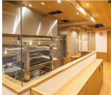
■ オープンキッチン 焼き菓子を作っている様子が見られる造りに