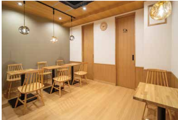
■ テーブル席 席同士の間隔を十分に空けて、ゆったりくつろげるように配慮