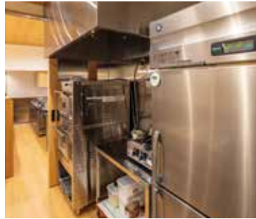
■ 厨房 美味しいお菓子作りを支える充実の厨房機器