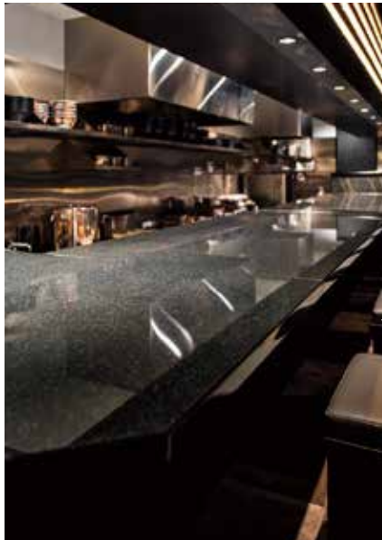
■カウンター 御影石、キングブラックのカウンターが美しい