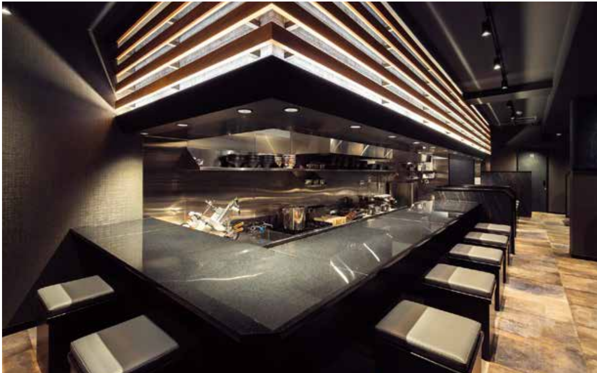
■メインカウンター席 カウンター上に設えられた木組みと間接照明が奥行きのある空間を演出してくれる