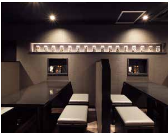
■テーブル席 アルコーブに出汁の素材、煮干しを展示して美味しさを演出