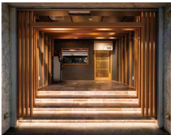
■エントランス 木組みと階段が奥行きのあるアプローチを印象づける