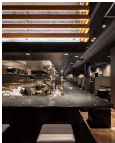
■立って作業するスタッフと座って食事するお客様と目の高さを合わせるために客席側を70cm近く底上げ