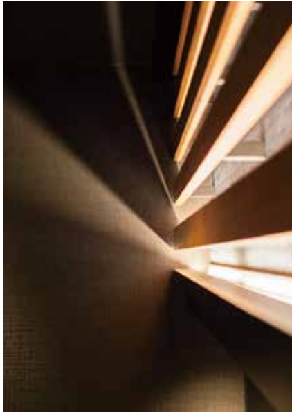
■カウンター上照明 木組みが創り出す陰影がシックな空間のアクセント