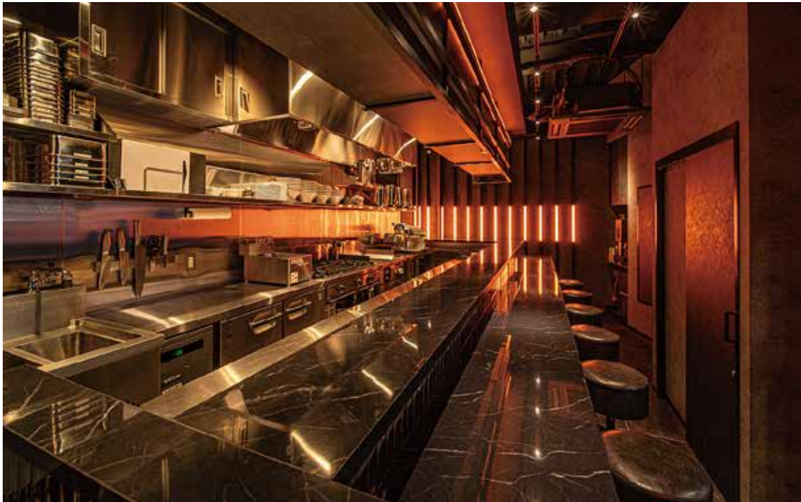
■メインカウンター席 LEDバーライトのカラーリングによって、がらりと空間の印象が変わっていく