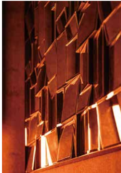
■カウンター バーライトの明かりが鏡のオブジェに照り映える