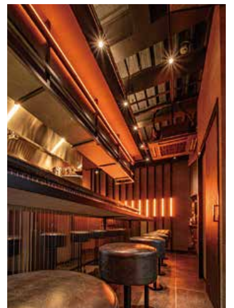
■カウンター下 ステンレス鏡面材がライトの光を反射して空間を妖艶な雰囲気に演出してくれる

Total Interior Service TIS Tel:06-6927-8131