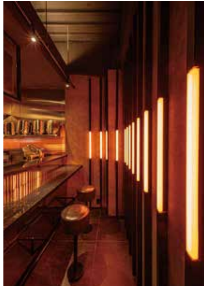
■カウンター奥 暖色のオレンジが照明のメインカラー