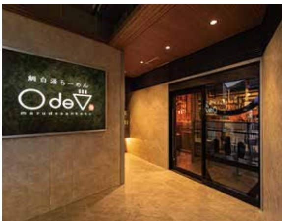
■エントランス ガラス張りのエントランスから見える光景が期待感を高めてくれる