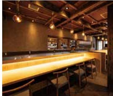
■ カウンター 間接照明で木目が鮮やかに浮かび上がります