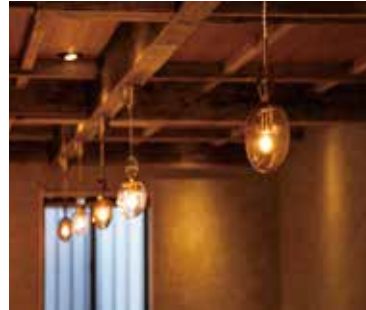
■ ボックス席 レトロな照明で落ち着いた雰囲気を出し出す