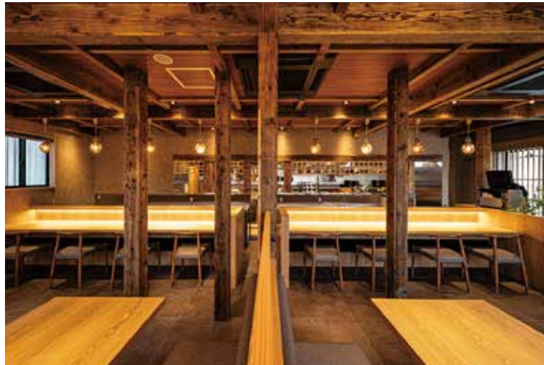
■cホール&カウンター席 食卓は華やかに彩りながらも、全体としては落ち着いた印象を照明の明暗で演出