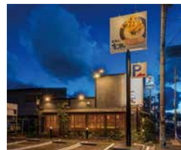
■ 駐車スペース 遠方よりのお客様を迎える駐車スペース