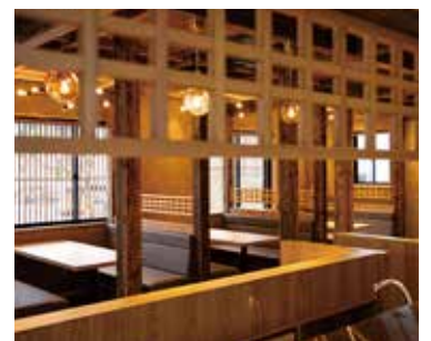
■ キッチンからホールへ 格子をあちこちに記して上質感を醸し出す