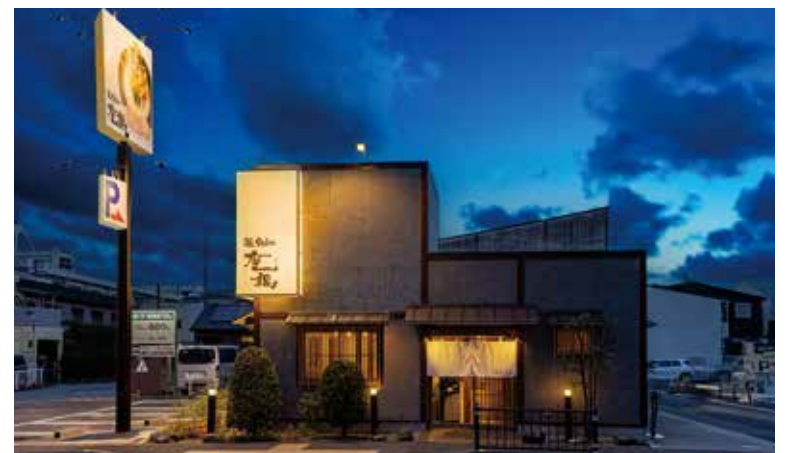
■ 外観 遠くからでも目に付く看板と、割烹のような佇まいを調和させたエクステリアデザイン