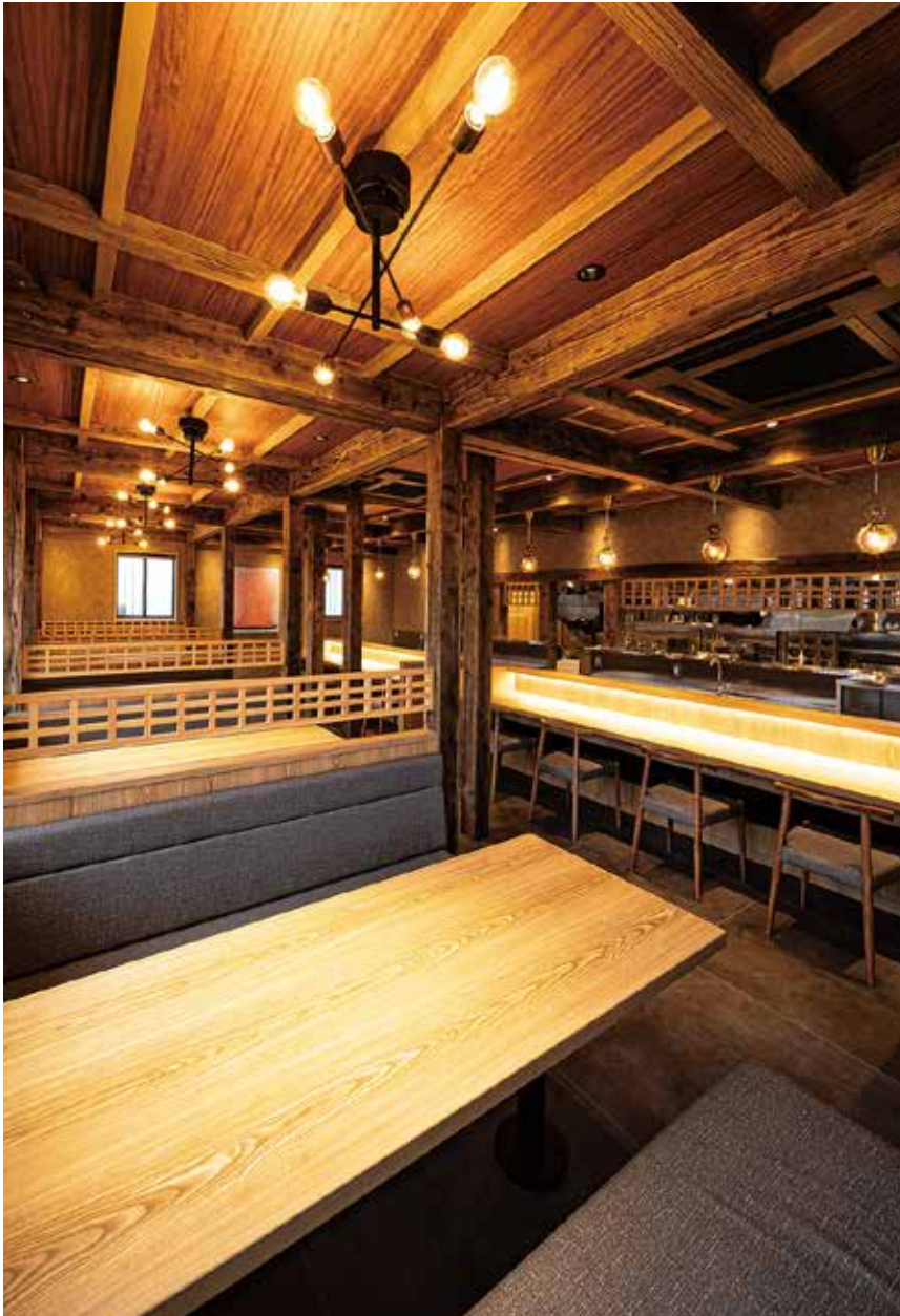
■ ボックス席から店内を ゆったりとしたスペース取りで上質なラーメンを家族みんなで味わえるように配慮したインテリア