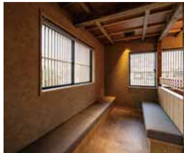
■ 店内待ち合い席 快適に順番を待つことで期待感を盛り上げる