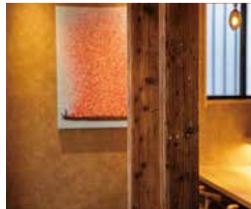
■ 古材を使ったしつらえ 古民家の木材で柱を飾り付け古色を演出